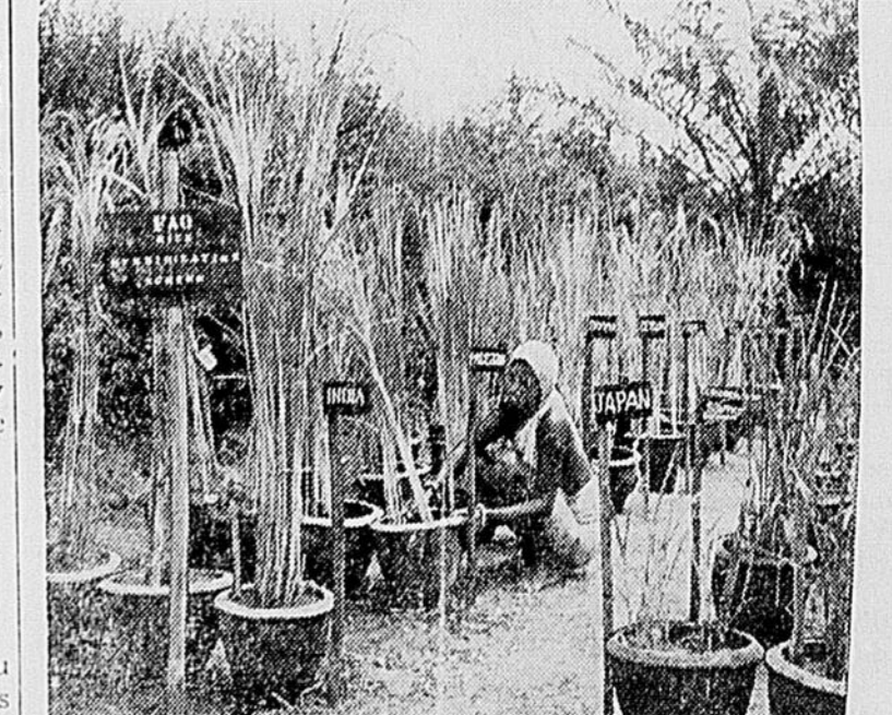
Neuf pays d'Asie ont uni leurs efforts à ceux de l'Organisation pour l'alimentation et l'agriculture des Nations Unies (FAO) dans la mise en oeuvre d'un programme d'hybridation du riz qui permettra d'obtenir un meilleur rendement dans des conditions clima- tiques et géographiques variables. Ci-dessus, quelques variétés de riz sur lesquelles portent les expériences que conduit la FAO à a Station internationale de recherches de Cuttack, dans l'Inde.