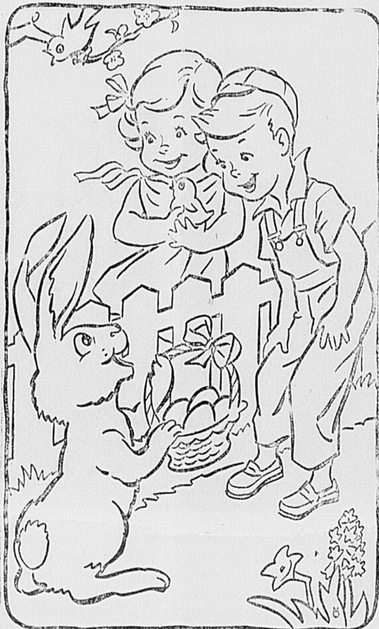
Le panier vert et jaune