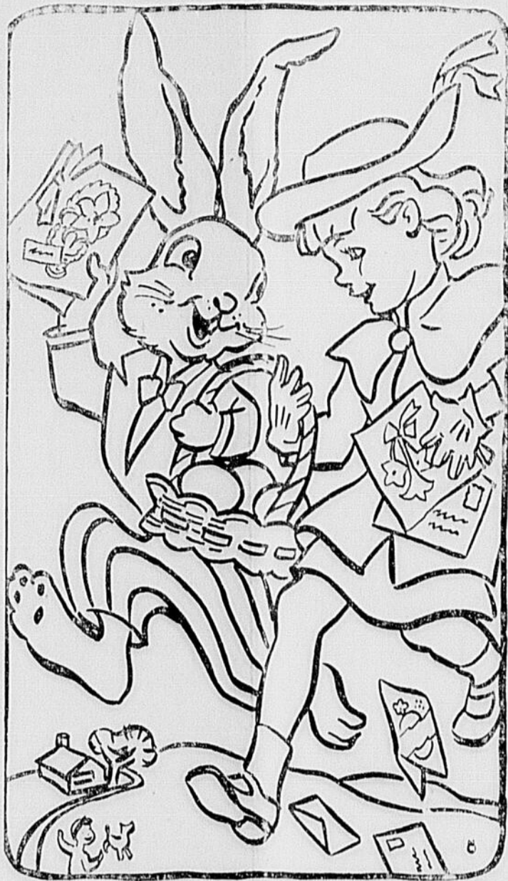
Souhaits de Pâques

Dans le domaine de la vie conjugale, l'union des époux est trop souvent conçue pour le plaisir au lieu d'être une vocation de la vocation des vieux Normands qui ont créé chez nous le climat d'une France nouvelle. La fréquentation de jeunes qui est à la base de l'érection sociale, méprise la pudeur et la dignité en préconisant l'indépendance et l'égalité des sexes pour justifier le prétexte d'une liberté mal comprise. Autant de problèmes qu'il faudra soumettre à la lumière des juges du Congrès afin de réintégrer dans l'esprit du christianisme notre attachement, notre fidélité au berceau de la race canadienne-française.