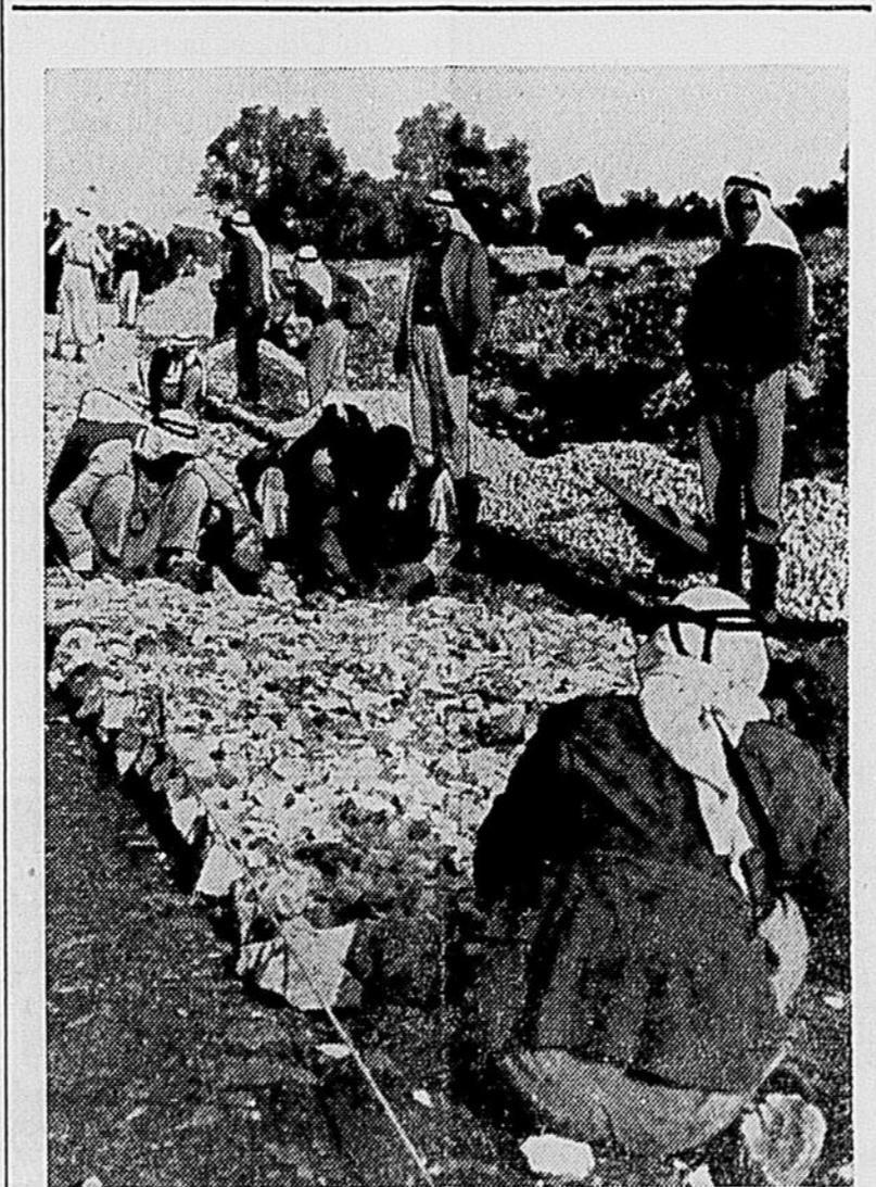
DES REFUGIES arabes construisent une nouvelle route, une des entreprises que l'Office de secours et de travaux des Nations Unies pour les réfugiés de Palestine (UNRWA) a mises sur pied dans le Proche-Orient afin d'aider des milliers de personnes à gagner leur vie