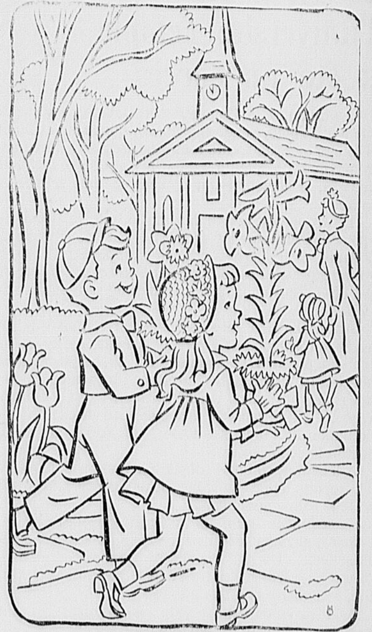
Matin de Pâques