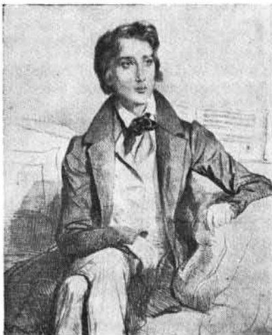
FRANZ LISZT, à 21 ans, d'après une lithographie de Deveria dessinée à l'époque où le jeune compositeur écrivait la transcription de la "Symphonie fantastique".

Dobrojan, c'était un maigre village. L'enfant y grandit entre un presbytère et une bergerie, devant un horizon où se dessinaient les crêtes de Styrie. Le dimanche, des tziganes s'installaient parfois dans le village et faisaient retentir de ces harmonies flamboyantes, par instant assoupies, puis renaissantes et jamais éteintes que sont leurs étranges musiques. Le père Liszt continuait, durant les