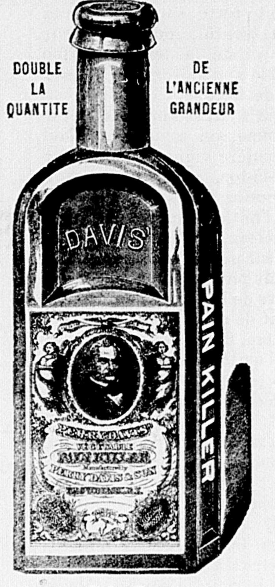
L'ancien Prix Populaire 25c. Jan à 19 6 93

TOUT NOUVEAU! L'AVEZ-VOUS VU? LE PAIN-KILLER GRANDE BOUTEILLE