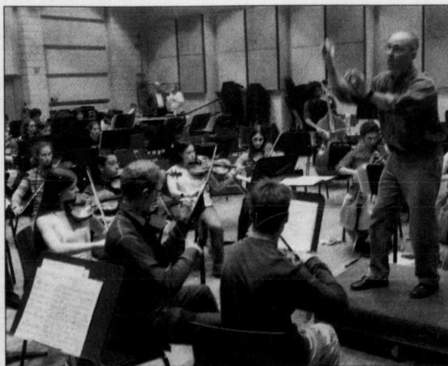
L'AOJM organise trois manifestations par année.

■ Association des Orchestres de jeunes de la Montérégie, concert du trentième anniversaire. Œuvres de Smetana, Mozart, Grieg, J. Strauss, Chabrier, Tchaïkovski, Bizet, Stravinski, Mascagni, Moussorgski et Respighi. Théâtre Maisonneuve de la Place des Arts, dimanche, 19h30. ☎ (514) 842-2112