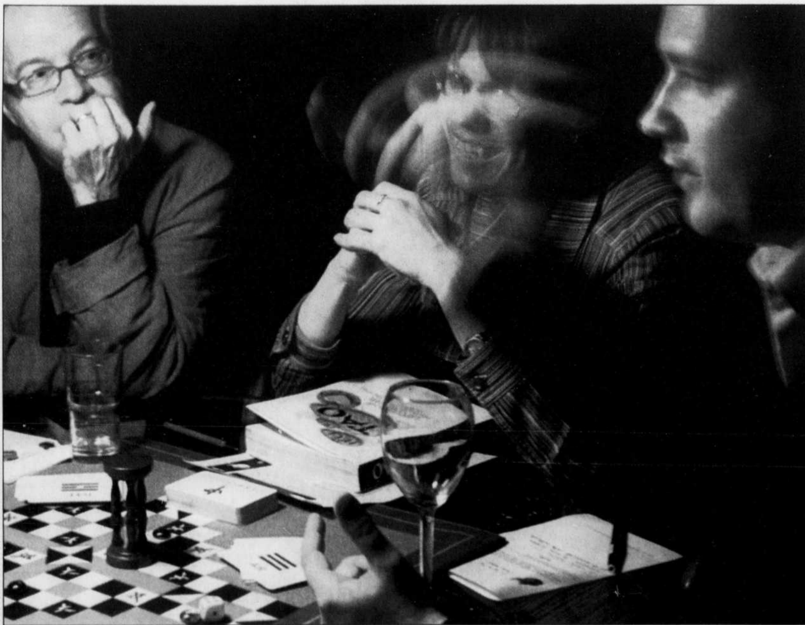
Des taobuddies révèlent leur quête au grand jour. Le jeu du tao, le strip-poker du nouveau millénaire.