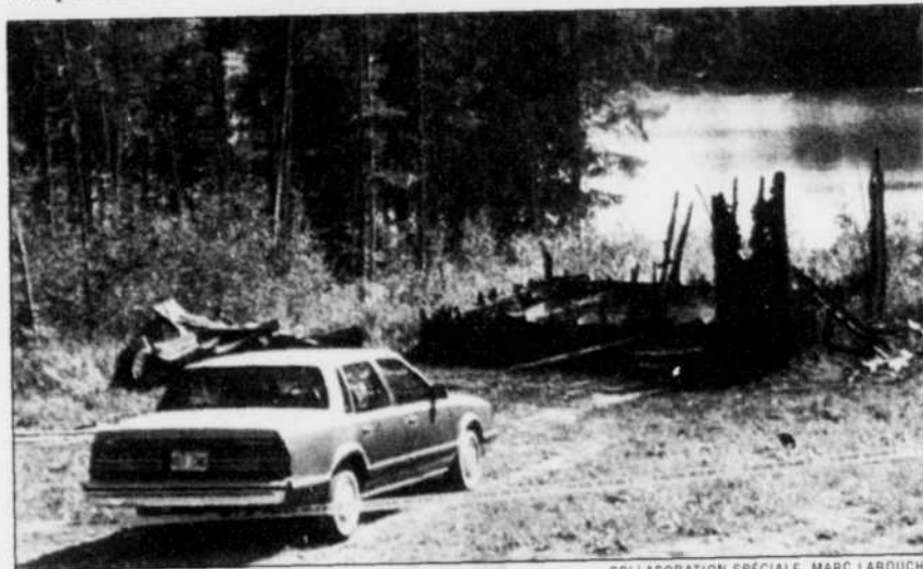
C'est dans ces débris que les corps des deux hommes ont été découverts par les pompiers et les techniciens en scène de crime de la SQ.

flagration peu avant l'incendie. « Cette possibilité a été écartée. Les gens ont probablement confondu avec un