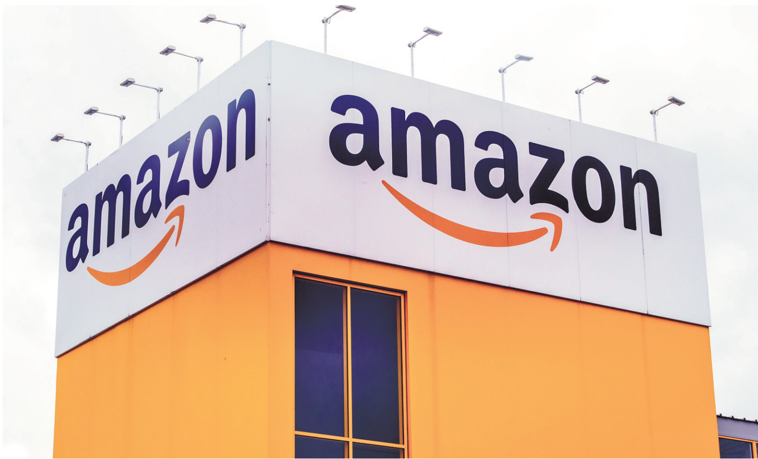
Un centre de distribution d'Amazon à Lauwin-Planque, dans le nord de la France