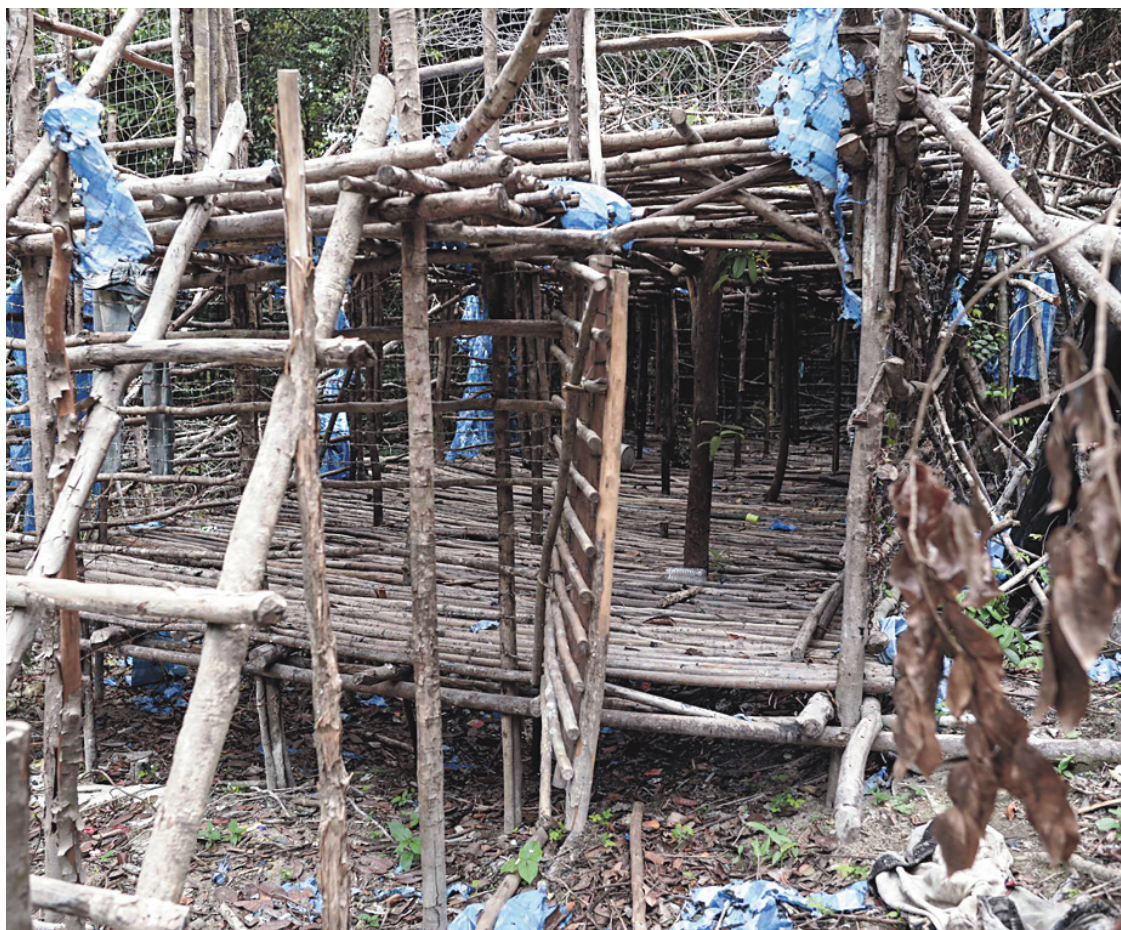
Ce camp abandonné aurait dans la jungle malaisienne, semble-t-il, été occupé jusqu'à récemment.

Une mâchoire humaine, dans laquelle des dents restaient plantées, était visible par terre. Dans le camp se trouve