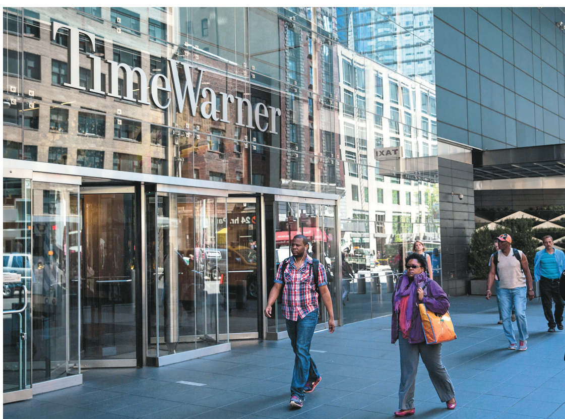
Le siège social de Time Warner Cable, à New York

Après cet échec, TWC était devenu l'objet de toutes les convoitises, au point que les