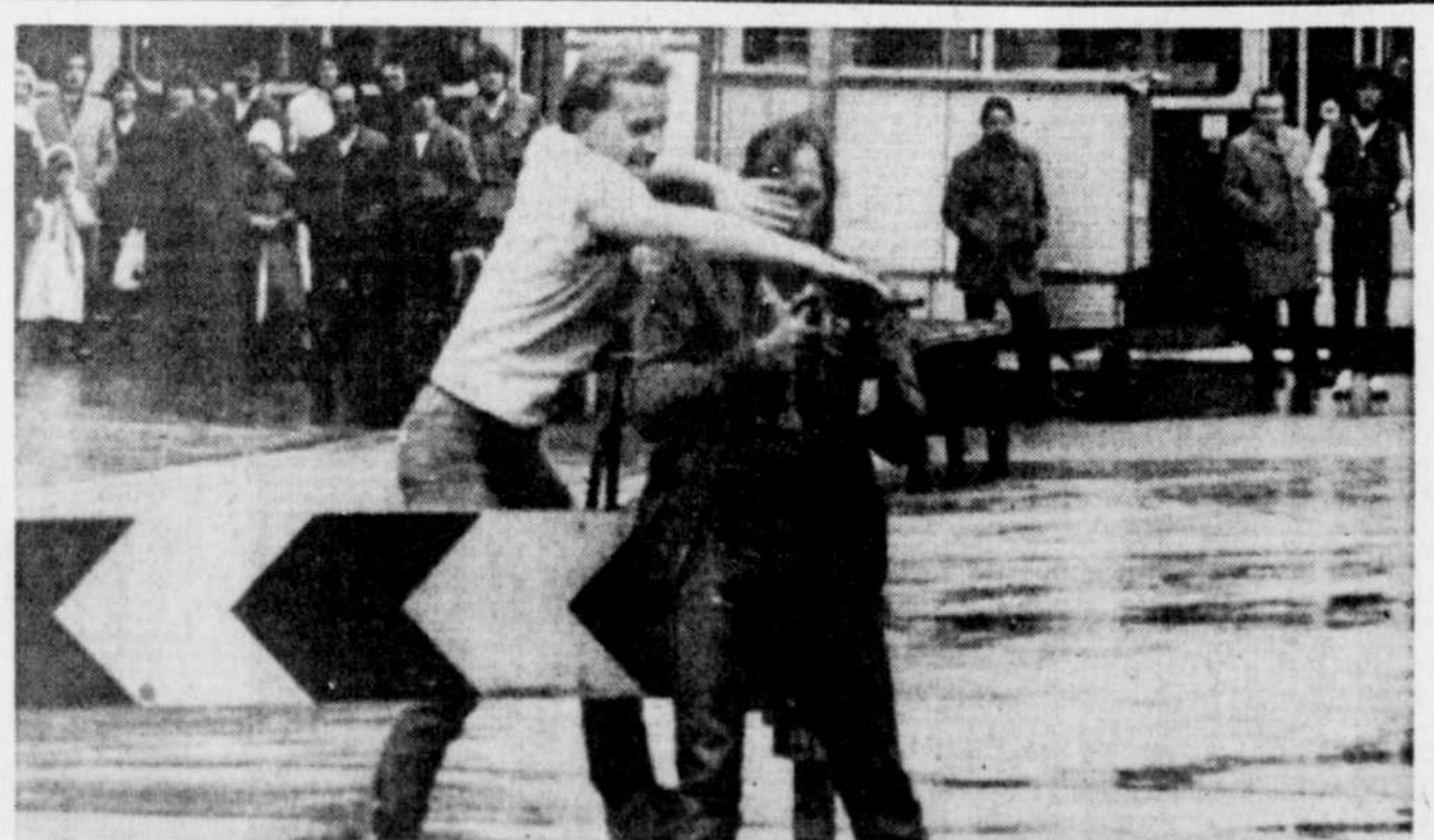
Bravoure Un passant a fait preuve d'un courage peu commun, samedi soir, à Berne en Suisse, quand il a assailli un homme armé et a réussi à lui enlever son revolver. Il l'a par la suite retenu jusqu'à ce que la police arrive sur les lieux. L'individu qui semblait avoir perdu la raison, s'était mis à tirer à gauche et à droite sans viser de cible précise. Heureusement personne n'a été blessé.