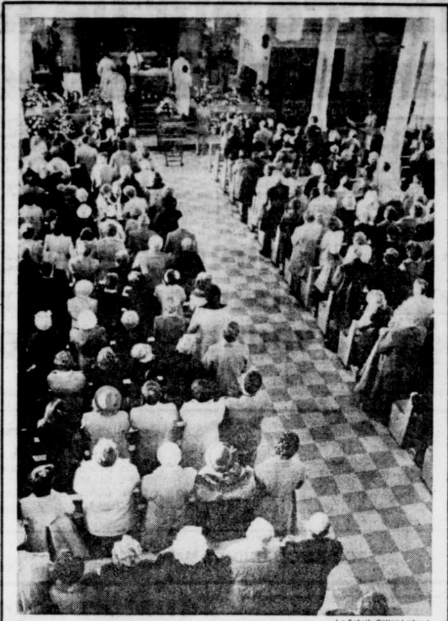
A son dernier repos