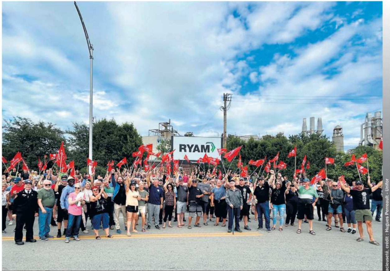
Rassemblement historique devant le complexe Ryam dont la fermeture de l'usine de cellulose de haute pureté a été amorcée en juillet.