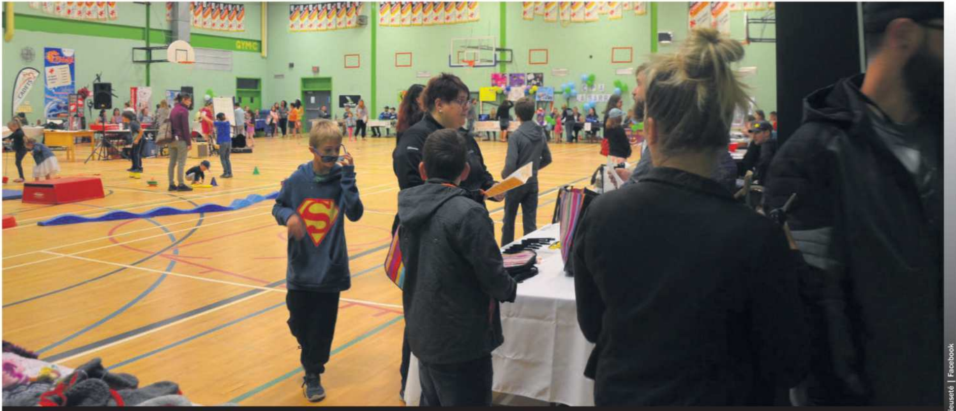
Salon des loisirs de l'Abitibi-Ouest en 2019 au gymnase de la cité étudiante Polyno.