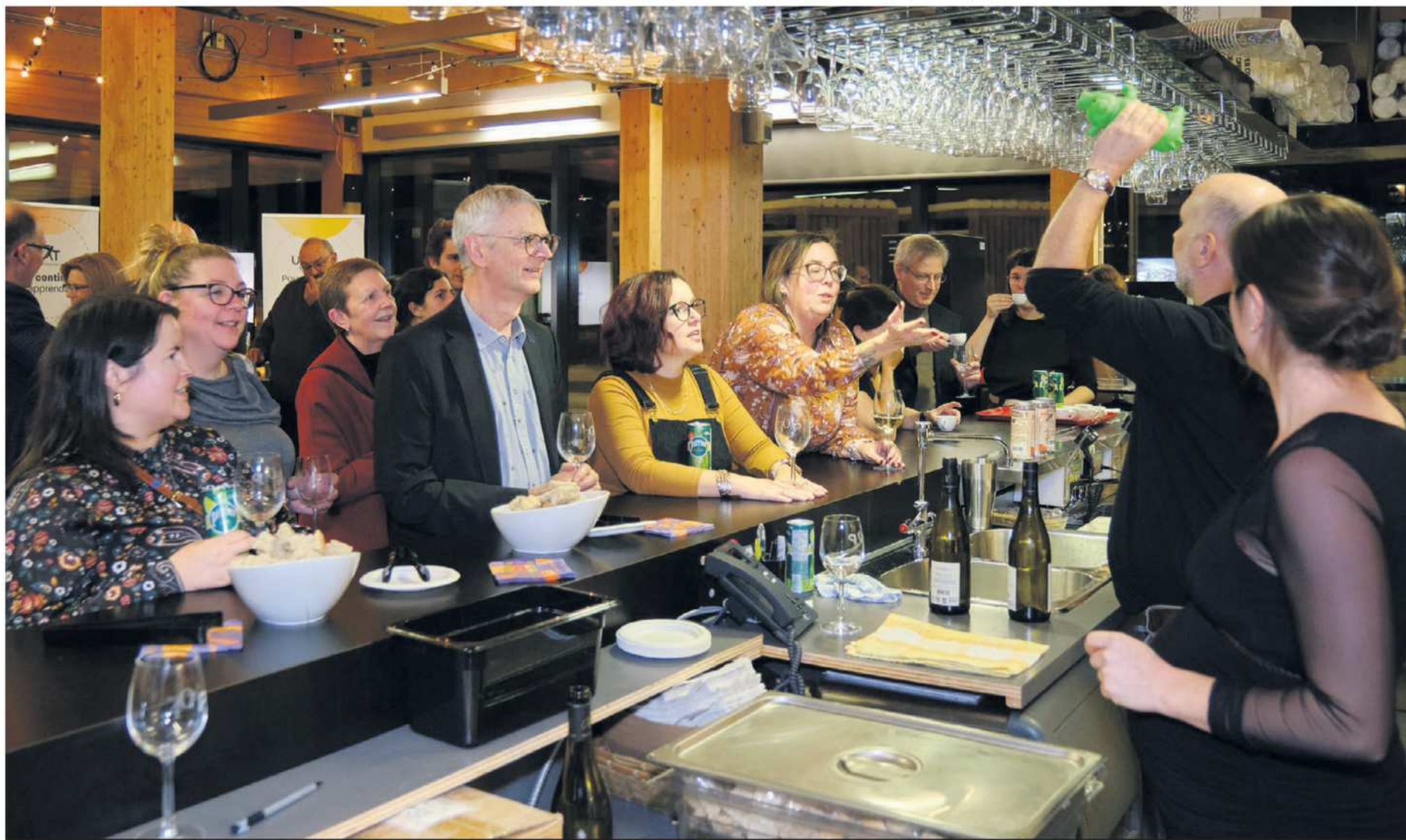
La 28 e soirée vins et fromage, une expérience gastronomique unique où la forêt boréale sera mise à l'honneur