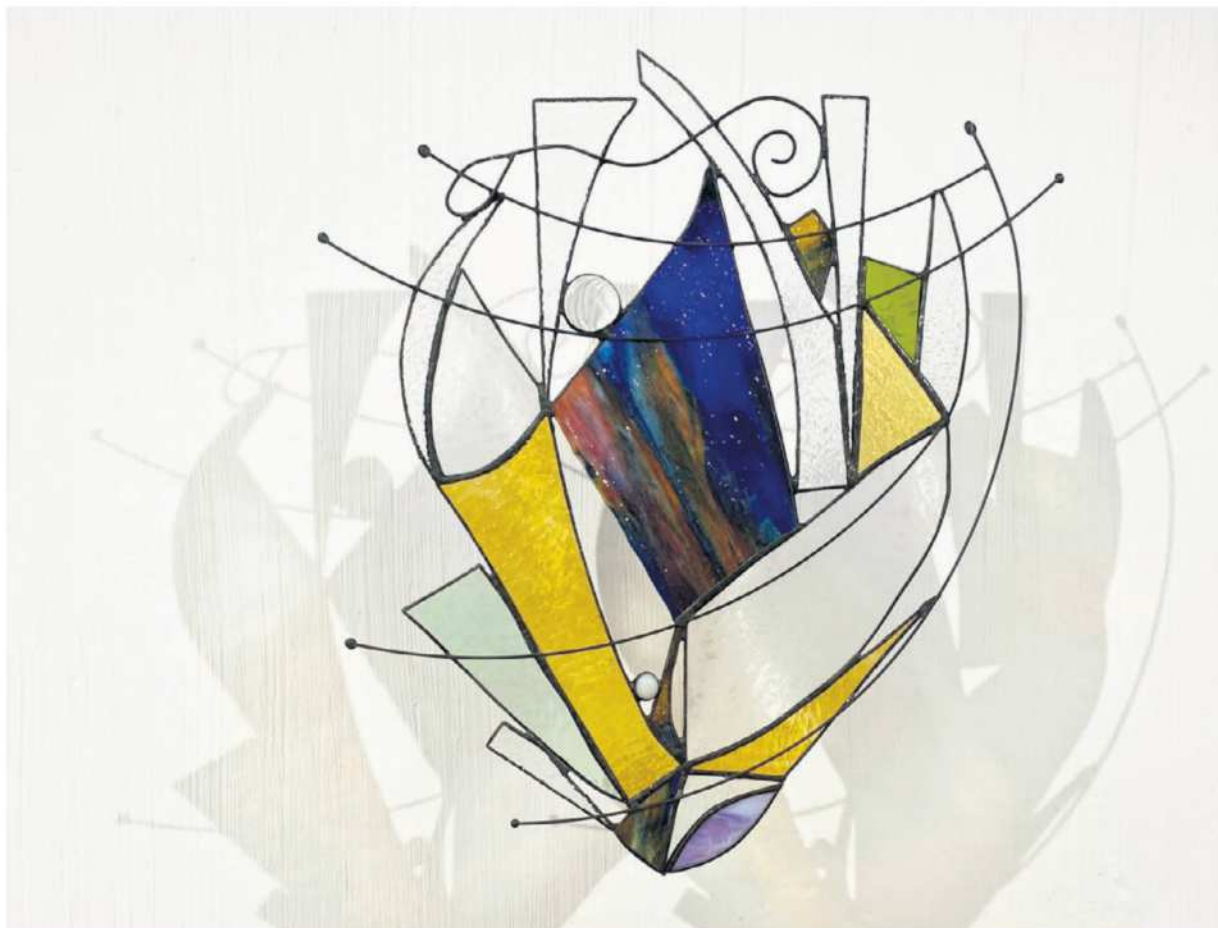
Exposition rayonnantes accolades de Lyne Noiseux.