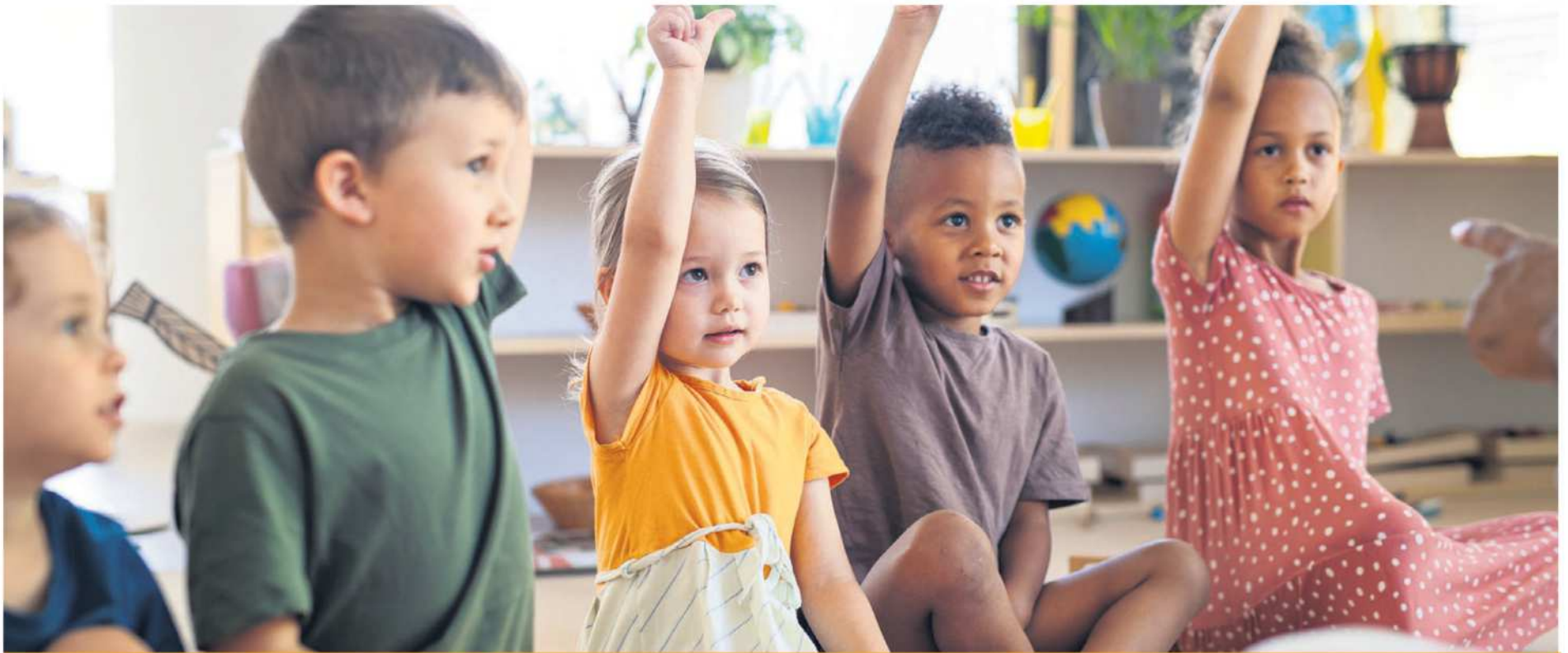
Le passage à la maternelle est une grande étape pour les enfants.