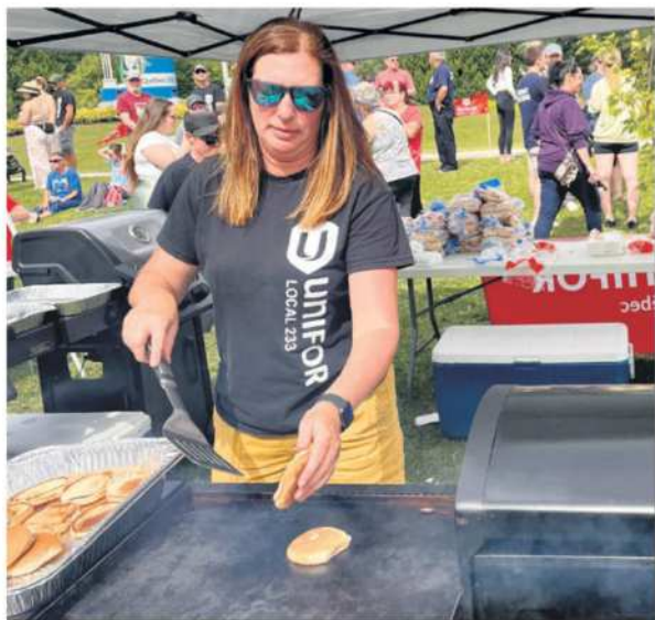
Le Barbecue de solidarité a connu un franc succès. Au moins 500 personnes s'y sont présentées à différents moments de l'événement.