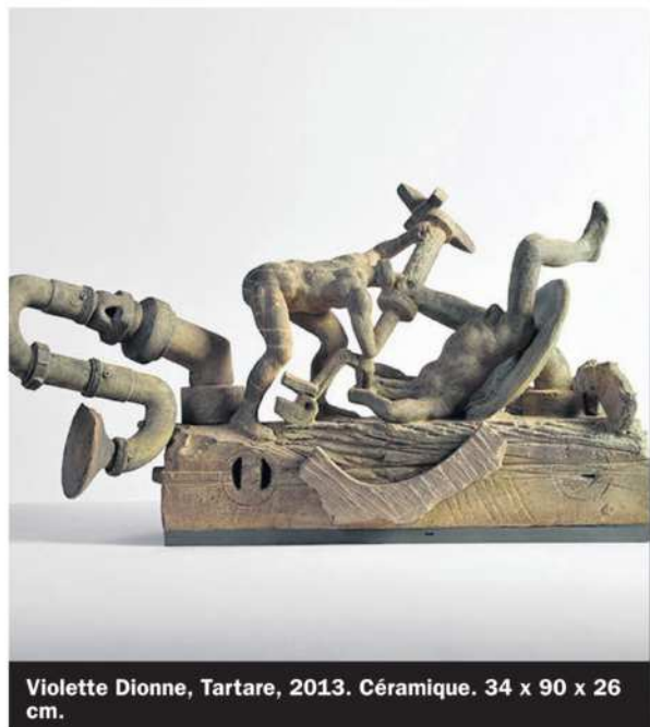
Violette Dionne, Tartare, 2013. Céramique. 34 x 90 x 26 cm.

Ricardo Jr Emmanuel | rjremmanuel@medialo.ca