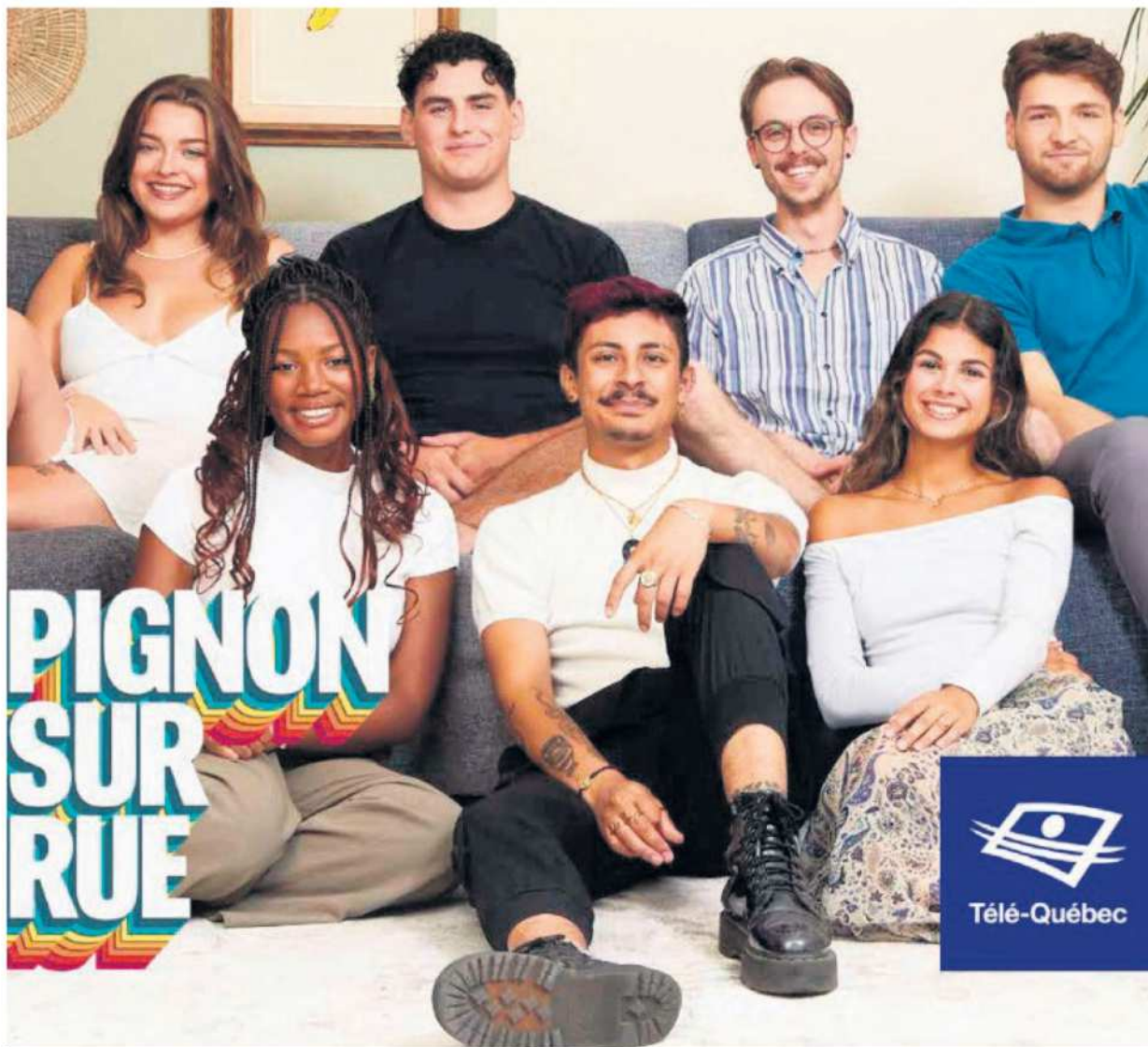
Pignon sur rue , une autre formule de télé-réalité de retour le 2 septembre sur les ondes de Télé-Québec.

Originaire d'une région éloignée, elle est profondément motivée par le désir d'acquérir de nouvelles expériences. Passionnée et dotée d'une personnalité intense, elle s'investit pleinement dans tout ce qu'elle entreprend. «Je veux donner une seconde chance à la ville de Montréal, je vais essayer de m'adapter.» rassure-t-elle.