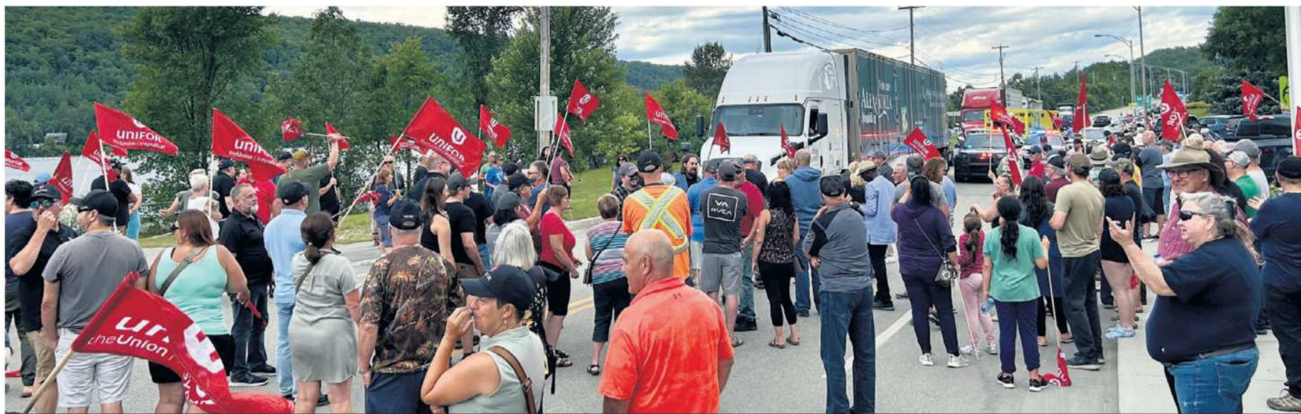
Plus de 50 ans plus tard, travailleurs de l'usine et supporteurs ont bloqué la circulation au même endroit, soit à l'entrée sud-ouest de la ville de Témiscaming en provenance de l'Ontario.