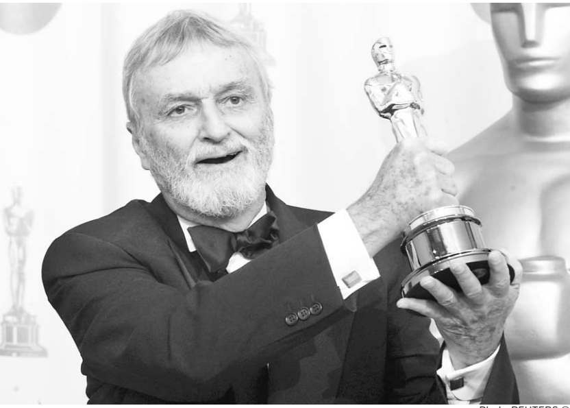
Conrad Hall a remporté un Oscar pour son travail sur American Beauty .

Il a également reçu des nominations pour sept autres films: Moriturus (1965), Les Professionnels (1966, avec Burt Lancaster, Lee Marvin et Claudia Cardinale), De sang-froid (1967, de Richard Brooks), Le Jour du féau (1975), Tequila Sunrise (1988, avec Mel Gibson et Michelle Pfeiffer), À la recherche de Bobby Fischer (1993) et Une action au civil (1998).