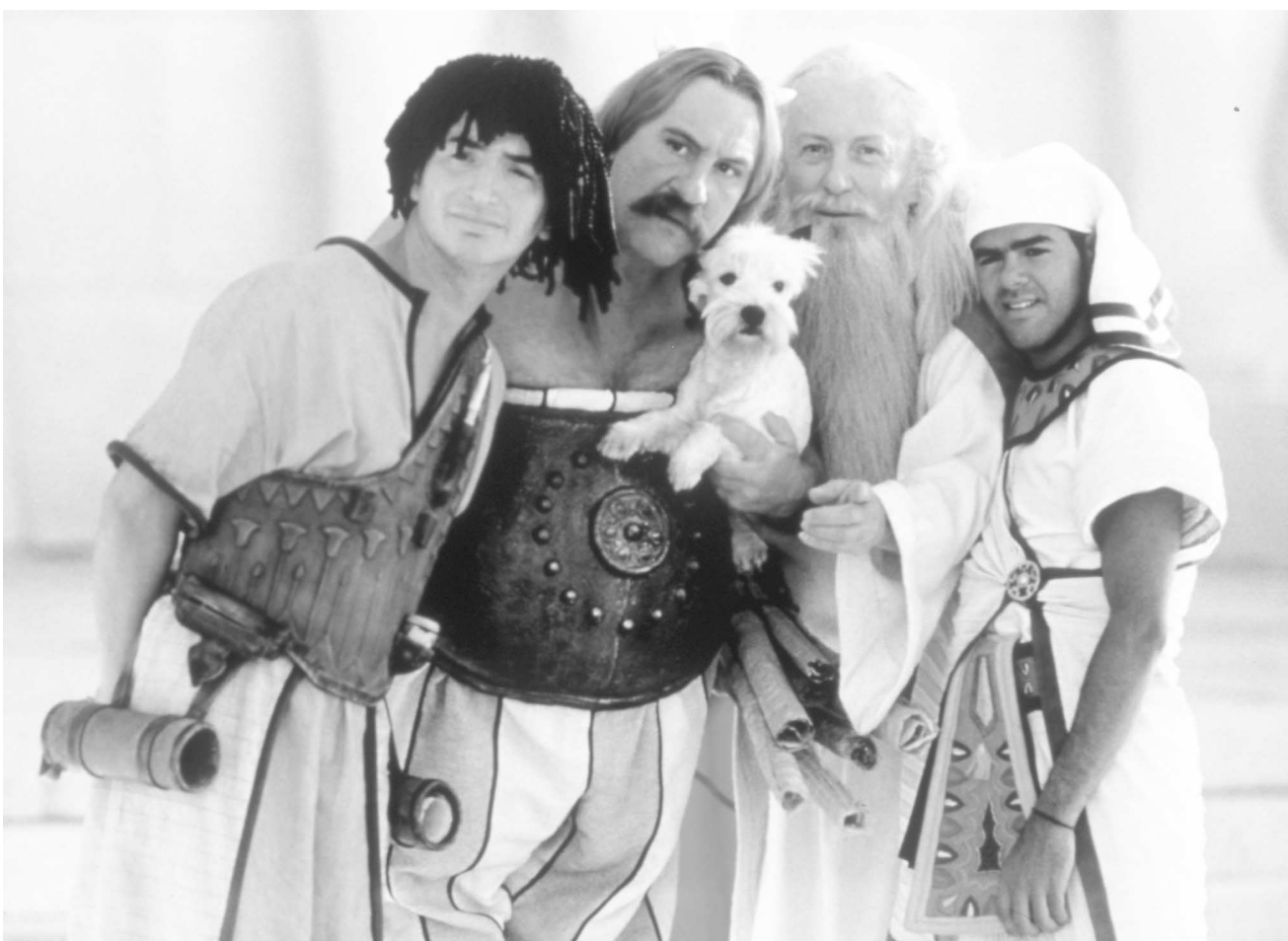
Édouard Baer (Otis), Gérard Depardieu (Obélix), Claude Rich (Panoramix) et Jamel Debbouze (Numérobis) ont donné un coup de main à Astérix pour atteindre le public français.

Le seul autre film français figurant au classement des 10 films les plus populaires est Huit Femmes du réalisateur François Ozon. Ce film mettait en vedette Isabelle Huppert, Catherine Deneuve et Emmanuelle Béart.