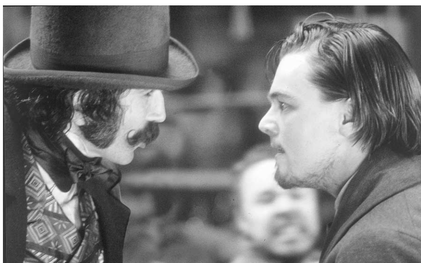
Daniel Day-Lewis et Leonardo DiCaprio s'affrontent dans Gangs of New York.

En revanche, une rétrospective de l'oeuvre du cinéaste allemand Friedrich Wilhelm Murnau, réalisateur de classiques du cinéma muet comme Nosferatu, est au programme.