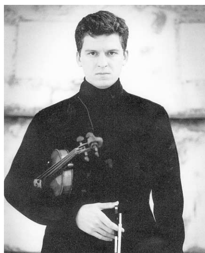
Le jeune violoniste James Ehnes donne un récital à Pro Musica lundi soir.

Comme cela se produit chaque année, des décès survenus en 2002 nous ont été signalés après le 31 décembre et donc trop tard pour être inclus dans notre nécrologie annuelle. On pourra compléter sa documentation avec les noms sui-