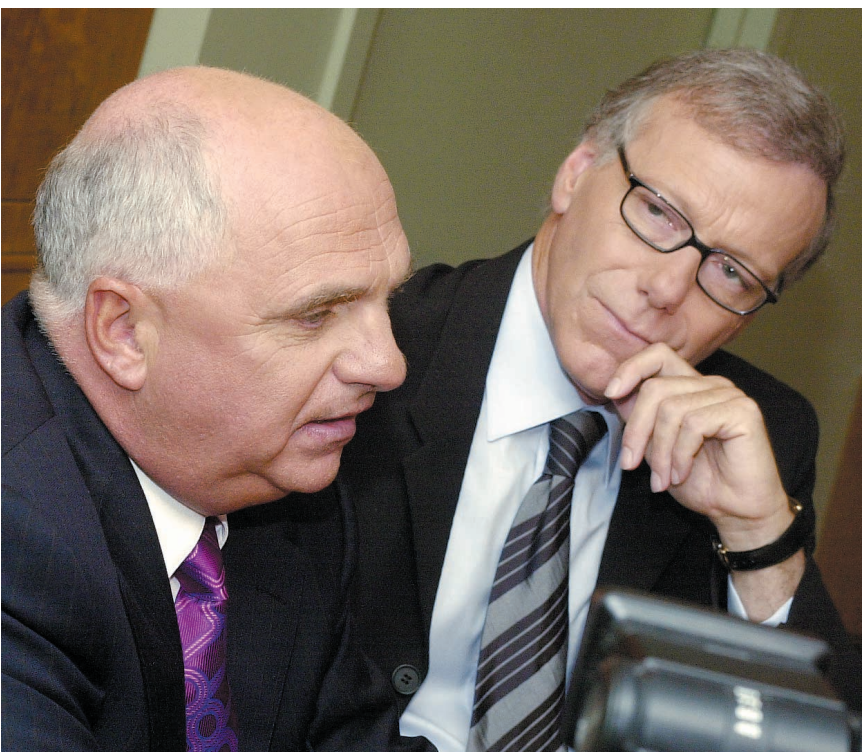
Jean-Luc Mongrain demeure le roi du bulletin de 17 h à TQS, malgré l'arrivée de Claude Charron aux côtés de Pierre Bruneau à TVA. À 18 h, ce dernier reste cependant numéro un, avec presque 100 000 téléspectateurs de plus que Mongrain. Quant à Raymond Saint-Pierre, il n'est même pas dans la course.