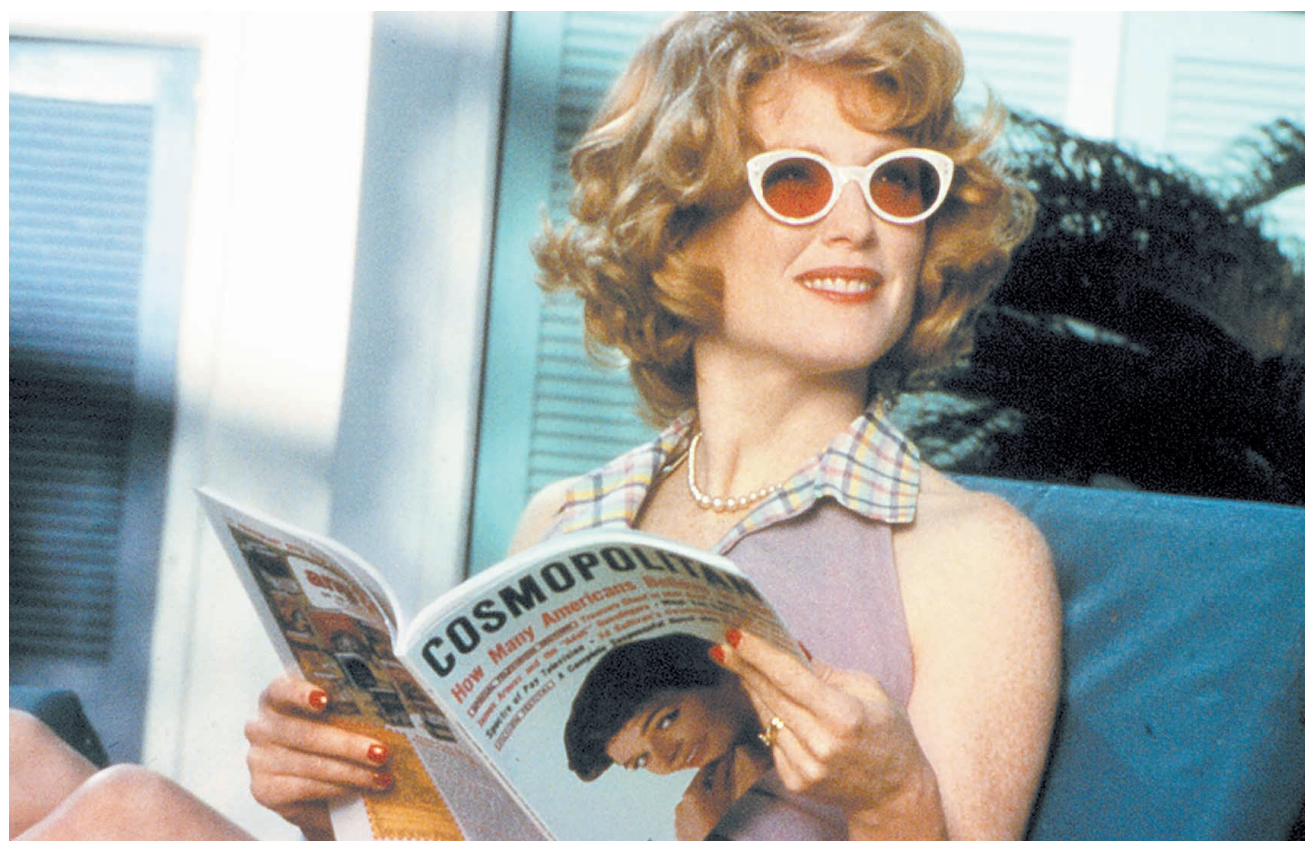
Deux interprétations remarquées : Julianne Moore dans Far from Heaven et Meryl Streep dans Adaptation .

> Reese Witherspoon, la vedette animée de Legally Blonde , dont le ca-