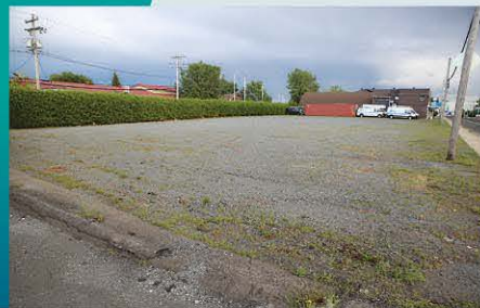
Le lot acquis de 23 500 pieds carrés est le terrain vacant de l'ancienne Coop.

Steve Martin | journaliste de l'Initiative de journalisme local