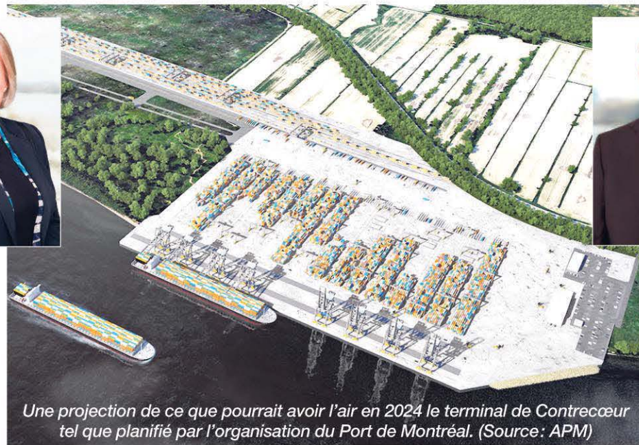
Une projection de ce que pourrait avoir l'air en 2024 le terminal de Contrecoeur tel que planifié par l'organisation du Port de Montréal.