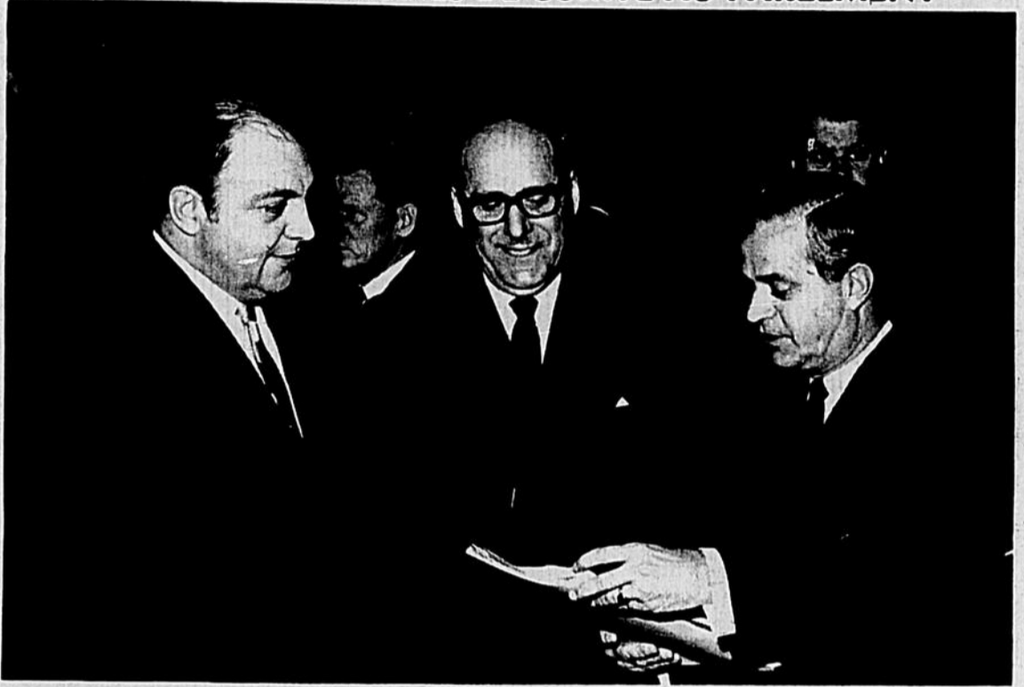
L'union des Conseils de comté a présenté son mémoire annuel au premier ministre du Québec, au Parlement. On reconnaît de gauche à droite: M. Robert Lussier, ministre des Affai-