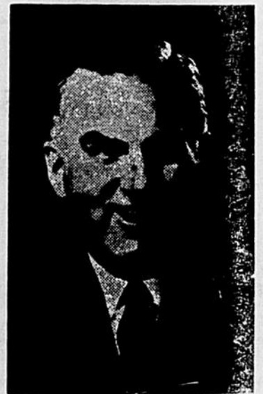
HON. MAURICE BELLEMARE député du comté de Champlain Ministre de l'Industrie et du Commerce Ministre du Travail