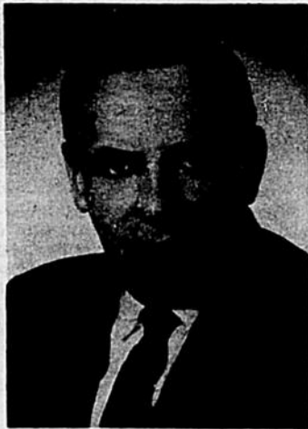
HON. YVES GABIAS député de Trois-Rivières Ministre des Institutions Financières