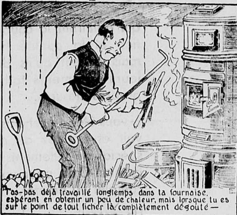
T'a pas déjà travaillé longtemps dans la fournaise, espérant en obtenir un peu de chaleur, mais lorsque tu es sur le point de tout ficher là, complètement désolé —