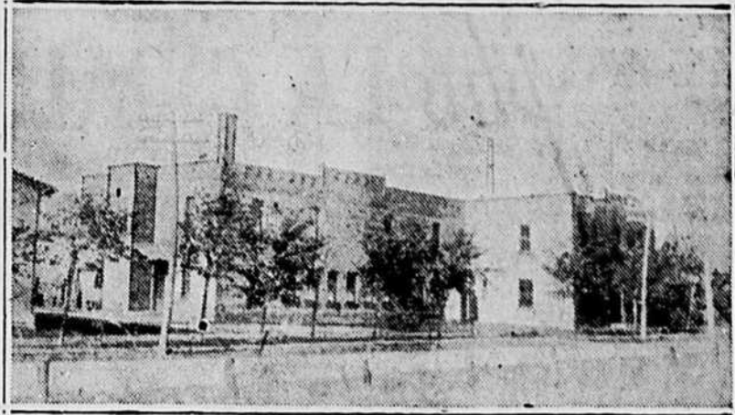
Vue des entrepôts de la Société Coopérative Agricole de Tabac du District de Joliette.

A cette fin la coopérative a acheté les entrepôts que possédait la Compagnie L.-O. Grothé, Limitée, et s'est engagée par contrat à