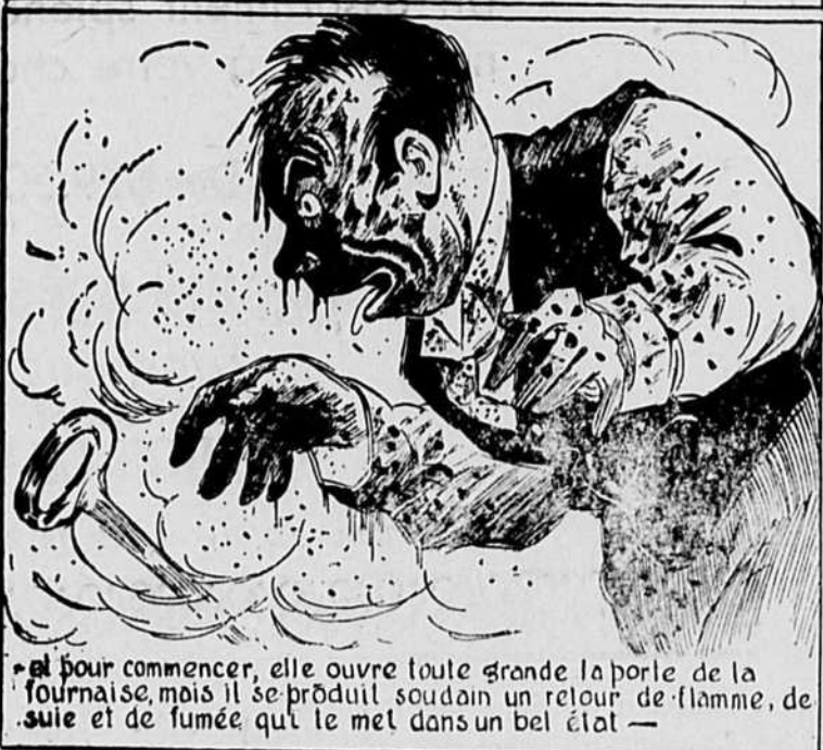
El pour commencer, elle ouvre toute grande la porte de la fournaise, mais il se produit soudain un retour de flamme, de suite et de fumée qui le met dans un bel état —