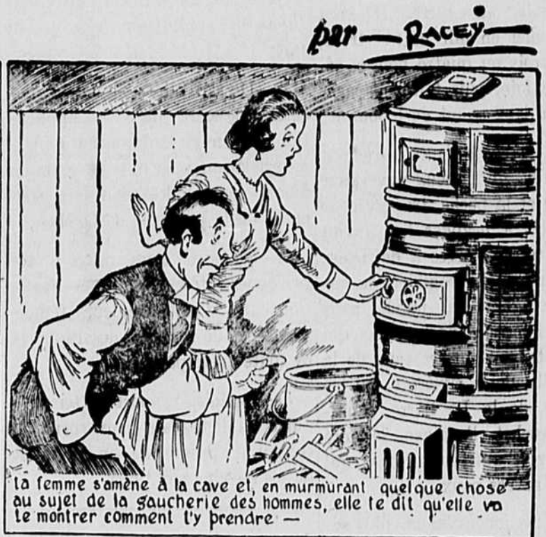
La femme s'amène à la cave et, en murmurant quelque chose au sujet de la gaucherie des hommes, elle te dit qu'elle va te montrer comment l'y prendre —