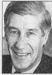
Joël de Rosnay

La crise environnementale nous oblige à reconstruire les ponts entre les sciences naturelles et humaines, affirme Joël de Rosnay. Le célèbre biologiste français estime que les nouvelles technologies ouvrent une possibilité extraordinaire d'organiser notre vie sociale en harmonie avec la nature. A lire lundi dans L'Entrevue.