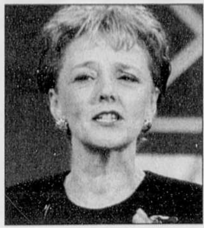
NOUVEAU PARTI DÉMOCRATIQUE