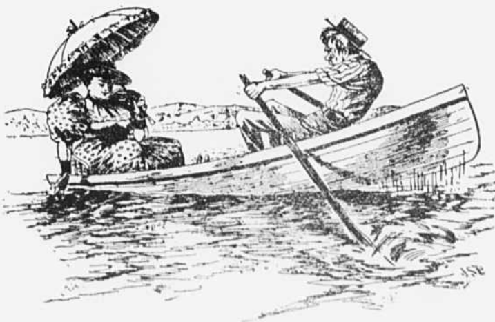
Miss Plumly, minaudant. — Le fait est que je n'ai pas assez de volonté. Tout le monde dit qu'on me mène comme on veut. Charles Horsd'haleine. — Sur terre ou sur mer ?