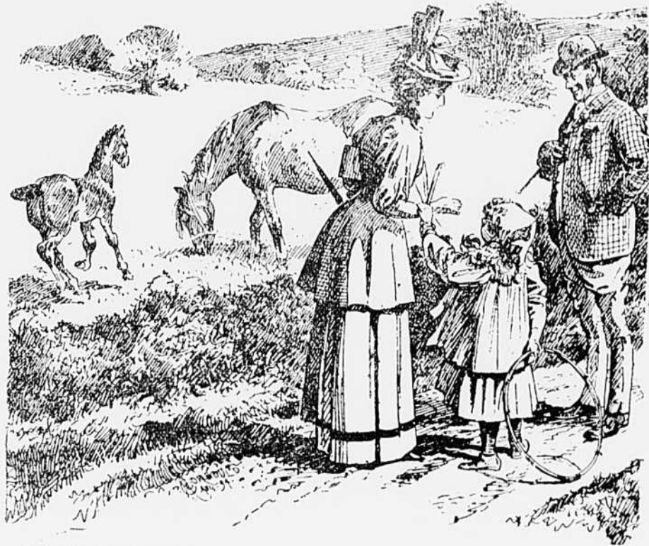
Lui. — Quel âge il a ce pony ? La maman. — Quinze jours, chère. Lili. — Mon petit frère, il a deux mois ; pourquoi ne le fais-tu pas courir comme le pony ?

spéciale pour les ombres des enfers, et on l'appelait le trou de Charron.