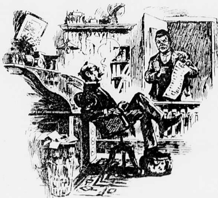
Le client.—Votre compte, c'est un vol ! L'avocat.—Mais c'est pour un vol aussi que vous allez en prison sans moi.