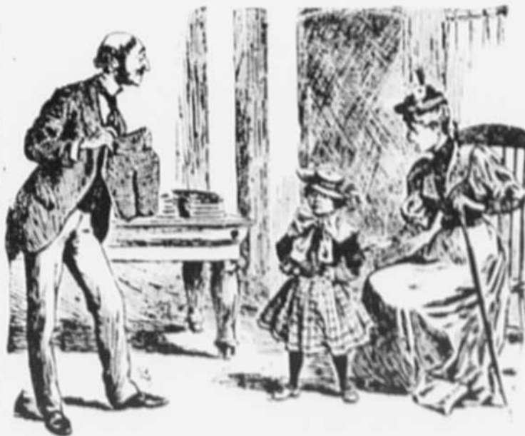
La maman, qui a décidé de mettre bébé en poussoir. — Vois, cher, comme il va être superbe, ton premier pantalon ! Bibi. — Pouah ! Tous les petits garçons vont rire de moi ; il n'y a pas de poche pour le revolver.