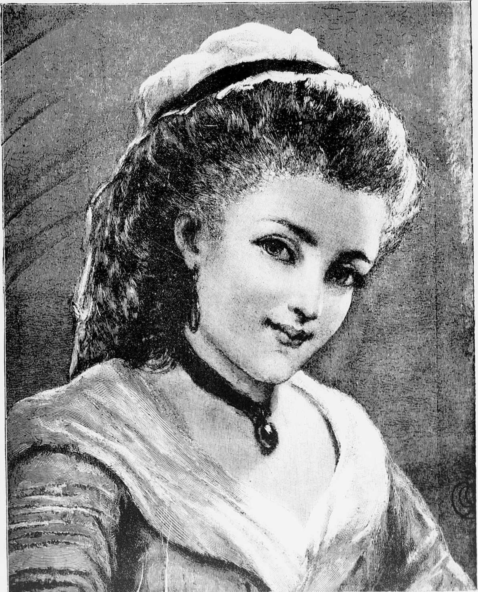
LA TOILETTE DU DIMANCHE.