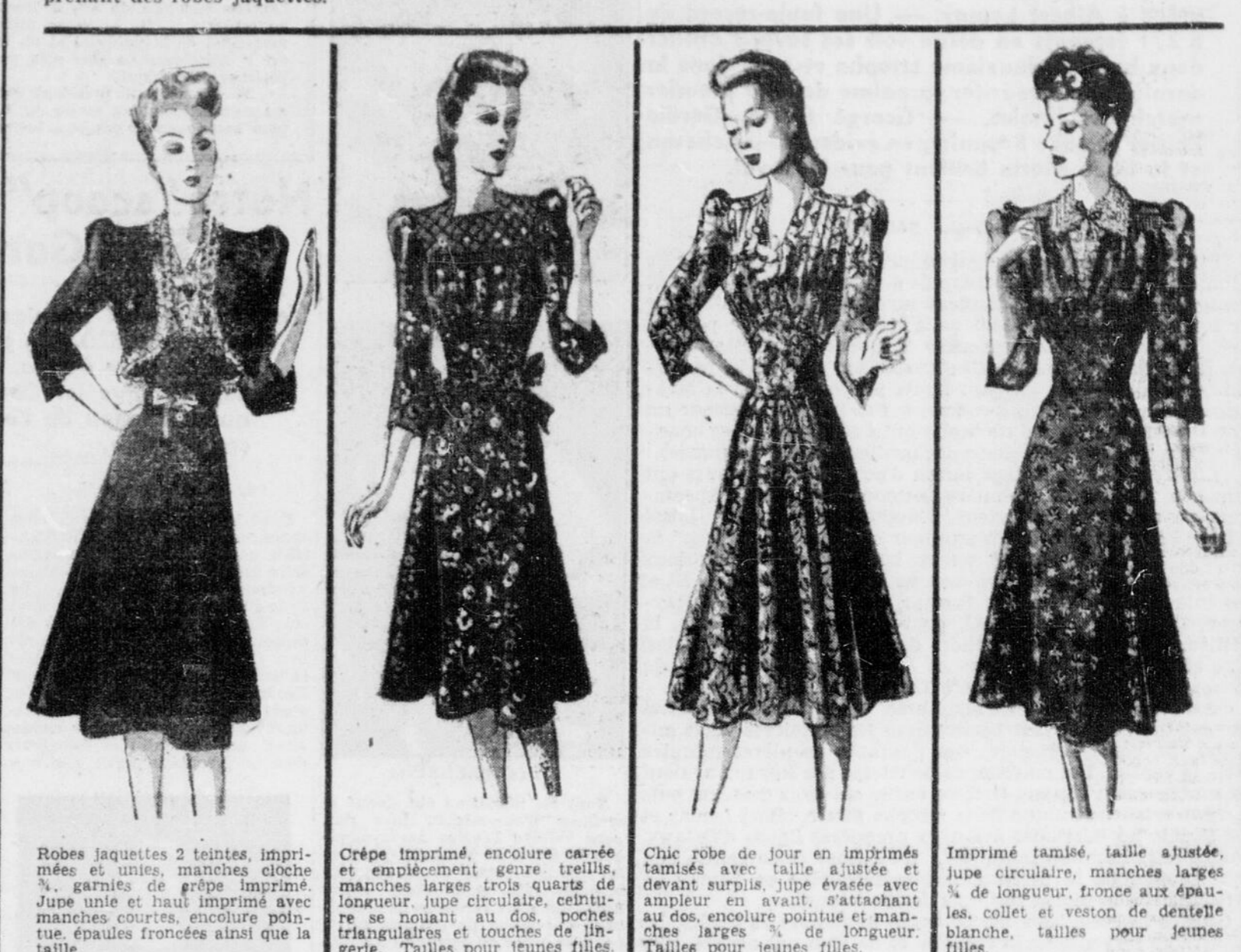
Robes jaquettes 2 teintes, imprimées et unies, manches cloche 3/4, garnies de grappe imprimée. Jupe unie et haut imprimé avec manches courtes, encolure pointue, épaules froncées ainsi que la taille.