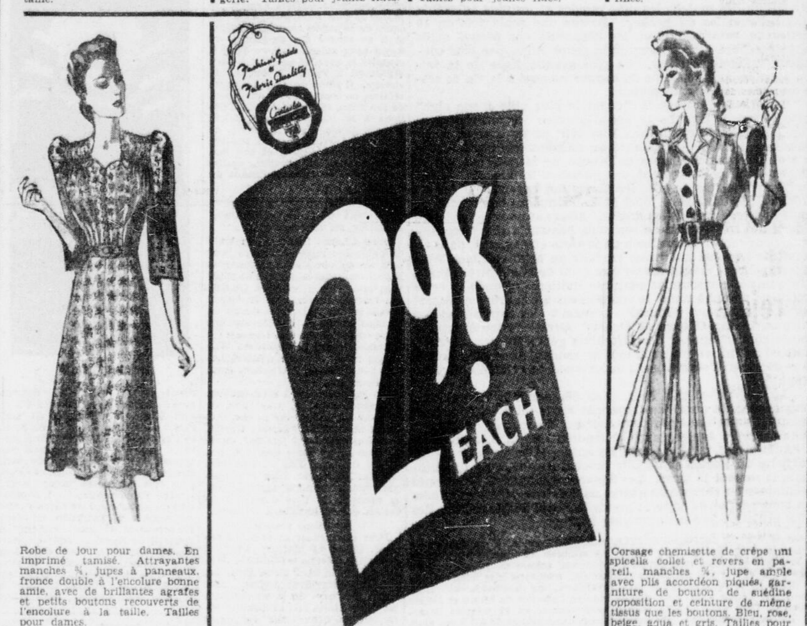
Robe de jour pour dames. En imprimé tamisé. Attractives manches 3/4, jupes à panneaux, fronce double à l'encolure bonne amie, avec de brillantes agrafes et petits boutons recouverts de l'encolure à la taille. Tailles pour dames.