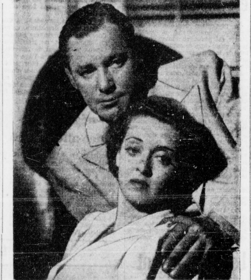
BETTY DAVIS et HERBERT MARSHALL dans le grand succès dramatique THE LETTER, à l'affiche aujourd'hui, vendredi et samedi, au Théâtre Cartier, en programme double avec I'M NOBODY'S SWEETHEART NOW, avec les vedettes DENNIS O'KEEFE et CONSTANCE MOORE.