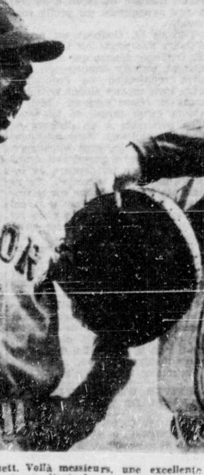
Pour Giants, Hubbell et Hartnett. Voilà messieurs, une excellente "batterie" de baseball. Les deux vétérans sont rendus à Miami, au camp d'entraînement de l'équipe de Bill Terry.