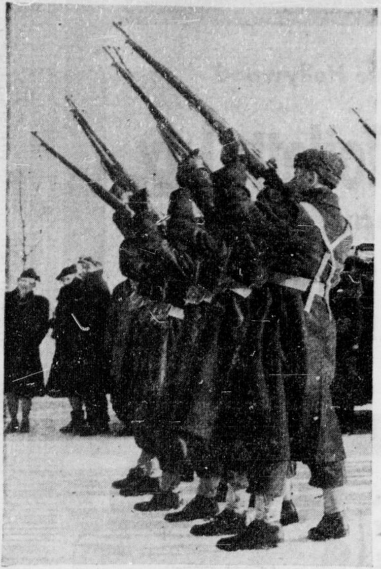
Trois salves ont rompu le silence lorsque les restes du grand savant sir Frédéric Banting furent descendus à leur dernier repos. Le corps des clairons a joué la sonnerie aux morts, et les soldats se sont mis à la position du salut, devant la dépouille mortelle.