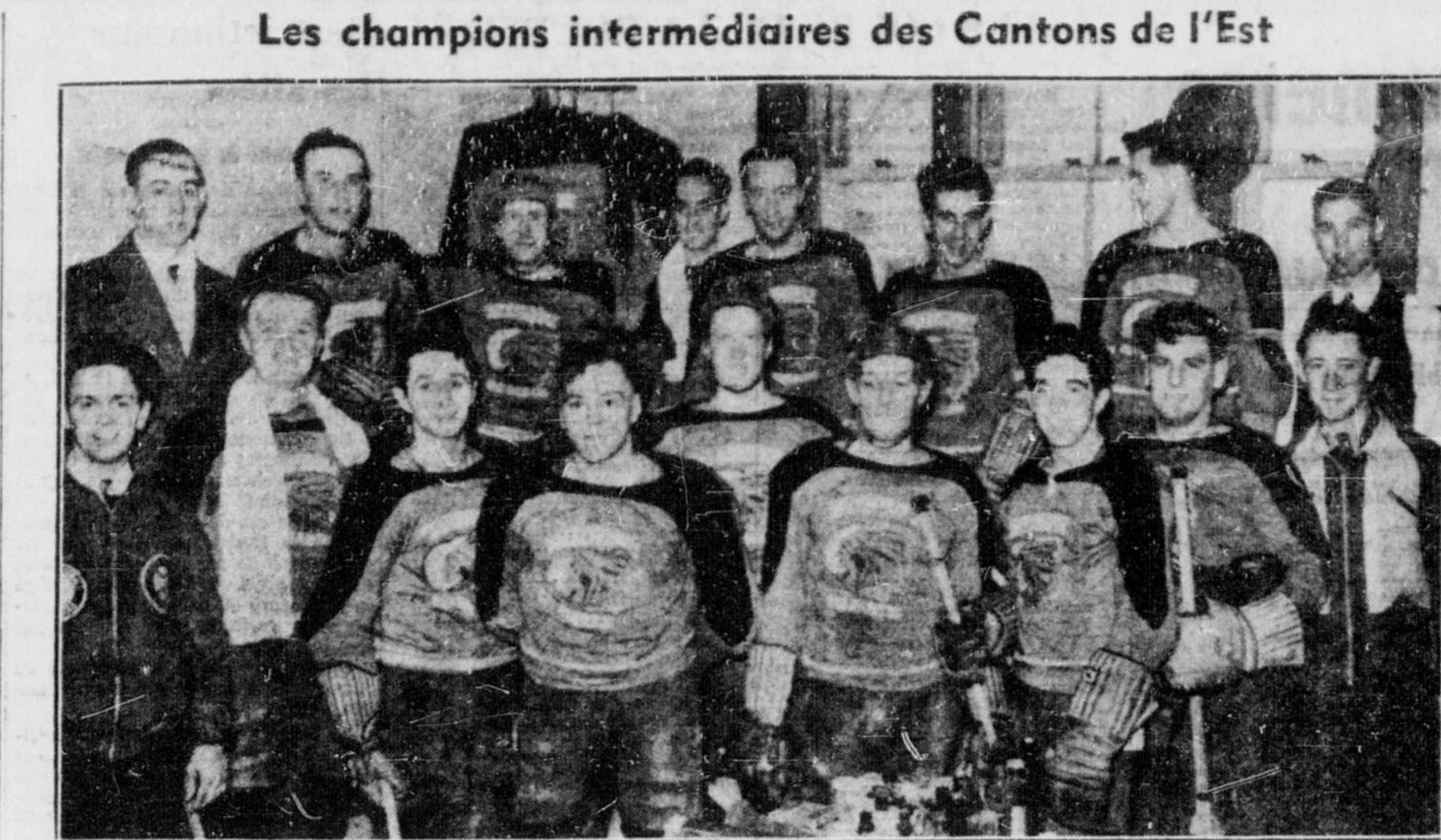
Voilà l'équipe des Indiens de Shebrooke, qui ont remporté le championnat de la Ligue Intermédiaire des Cantons de l'Est en battant les Monarques de Richmond par 12-8 dans la série finale de deux parties...