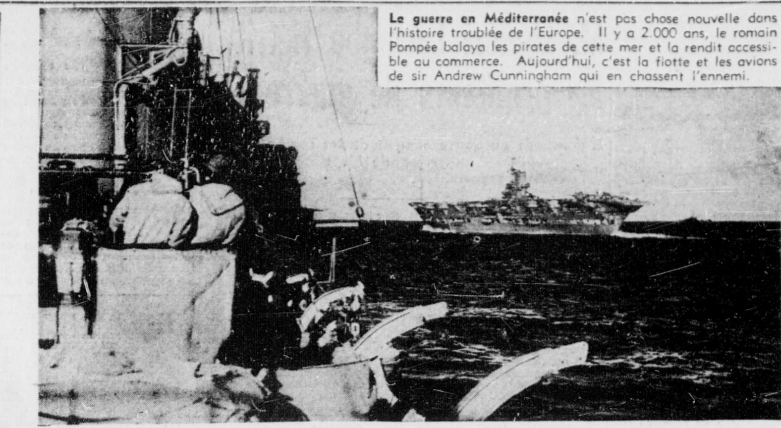
La guerre en Méditerranée n'est pas chose nouvelle dans l'histoire troublée de l'Europe. Il y a 2.000 ans, le romain Pompée balaya les pirates de cette mer et la rendit accessible au commerce. Aujourd'hui, c'est la flotte et les avions de sir Andrew Cunningham qui en chassent l'ennemi.