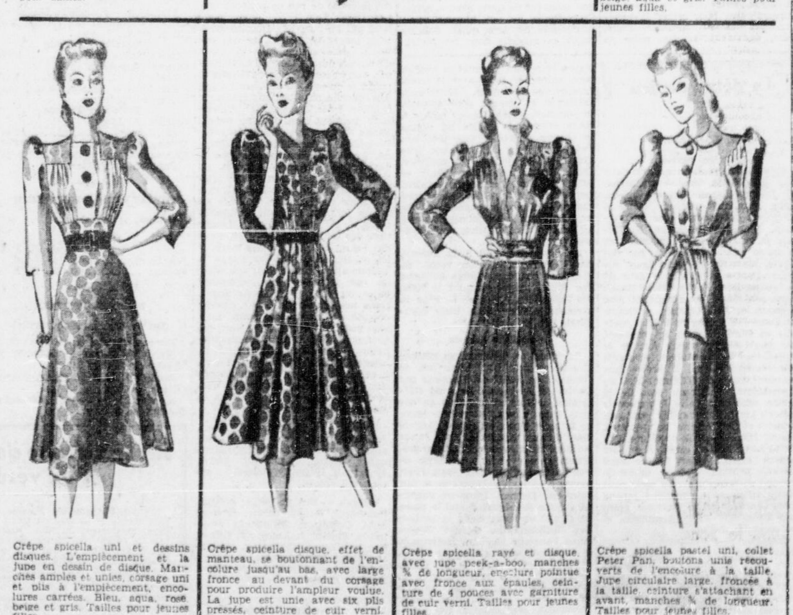
Crêpe spicella uni et dessins disques. L'empicement et la jupe en dessin de disque. Manches amples et unies, corsage uni et bis à l'empicement. Encolure carrée. Bleu, aqua, rose, beige et gris. Tailles pour jeunes filles.