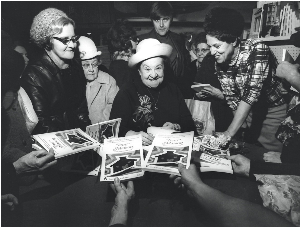
Figure 6. Françoise Gaudet-Smet au magasin Dupuis Frères, à Montréal, lors d'un événement en lien avec le lancement de Tenir maison , 29 novembre 1968.

Françoise a toujours su se faire valoir auprès de son public, dans une sorte de « marketing » de soi qui a servi à faire connaître et rayonner Paysana comme ses autres entreprises. Mais l'après Paysana s'amorce difficilement; son mari Paul Smet, décède en 1950. Elle écrira, publiera et éditera de plus belle, des livres, des contes, des billets dans les journaux, des carnets et des cahiers d'artisanat, plus tard des agendas; elle n'arrête pas, poursuivant toujours son éducation populaire alors qu'elle propose, entre autres, des cures de « santé culturelle » — selon sa propre expression — et des cours d'été. Elle fait beaucoup de radio, puis de la télévision entre 1967 et 1983 60 , canaux puissants pour rejoindre « ses amies » et des auditeurs nombreux, car elle a compris le pouvoir des médias (figure 6).