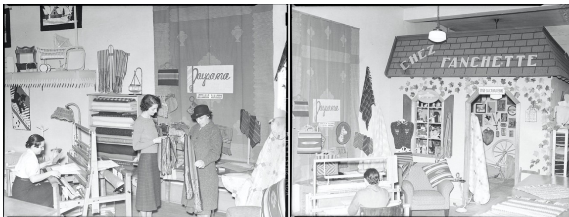
Figure 3. Chez Fanchette, avril 1938. La boutique était sise au 1610 ouest, Sainte-Catherine.