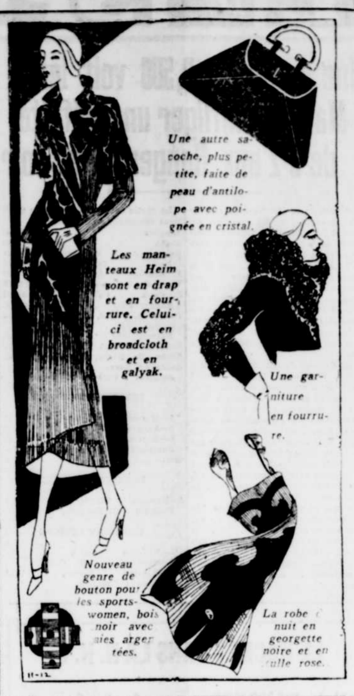
Une autre sacochette, plus petite, faite de peau d'antilope avec poignée en cristal. Les manteaux Heim sont en drap et en fourrure. Celui-ci est en broadcloth et en galyak. Une garniture en fourrure. La robe de nuit en georgette noire et en tulle rose. Nouveau genre de boutons pour les sports-women, bois noir avec aigrettes.