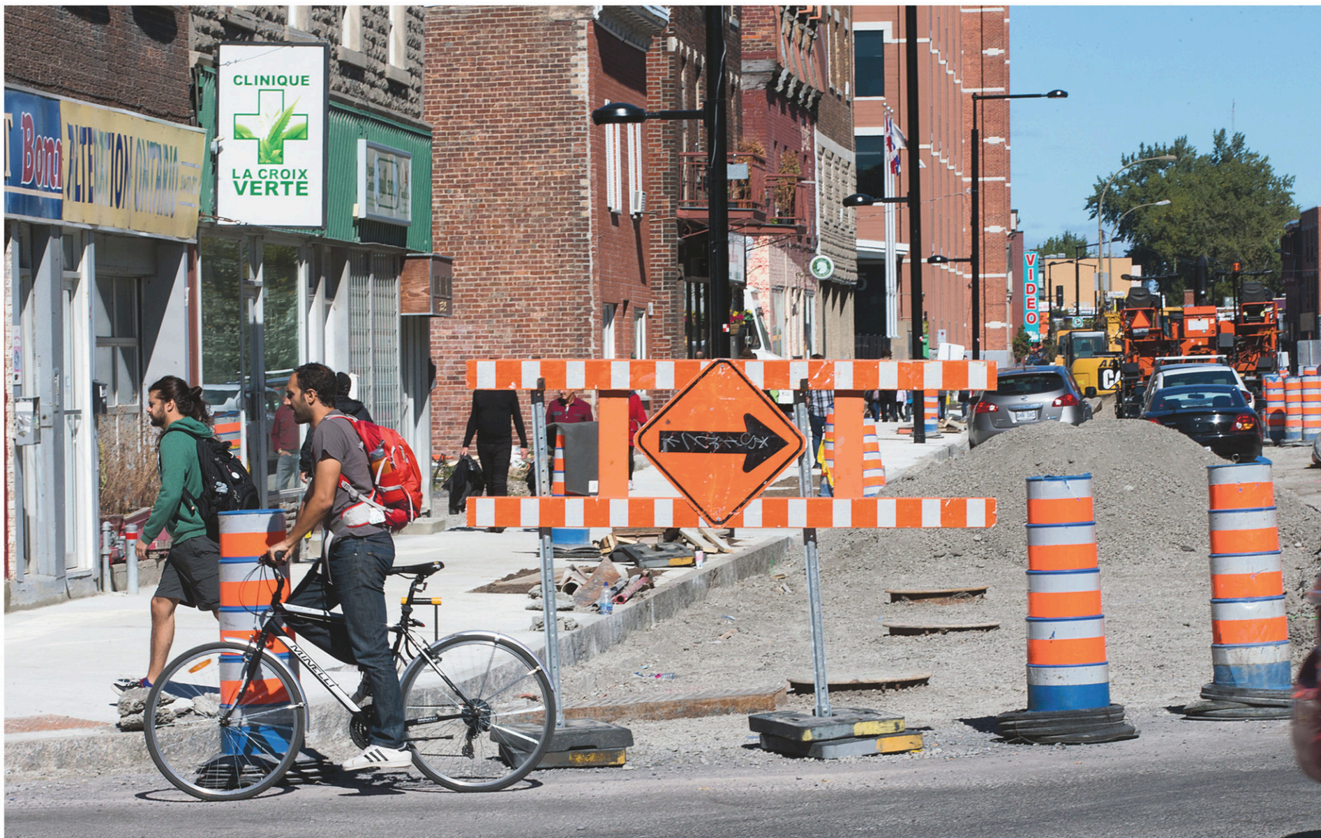
Aux abords de la station de métro Frontenac, la rue Ontario a des airs de champ de bataille depuis plusieurs années déjà.

Les travaux de la rue Saint-Denis devaient prendre fin en novembre 2016. Au grand bonheur des passants et des commerçants, l'entrepreneur responsable du chantier a toutefois réussi à terminer les travaux plus d'un mois en avance et l'artère sera à nouveau accessible sans entrave à compter de ce lundi. Cette rapidité d'exécution vaudra aux Entreprises Michaudville, responsables des travaux de réfection de la rue entre Duluth et Marie-Anne, une prime pouvant aller jusqu'à 10 000$. Il s'agit du premier entrepreneur à pouvoir se prévaloir de cette clause de rapidité depuis son instauration par la Ville de Montréal en 2015.