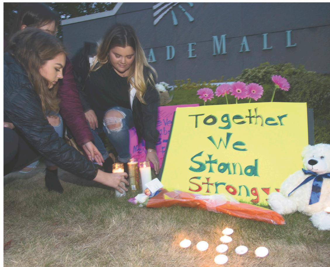
Des gens se sont recueillis près du centre commercial Cascade Mall en mémoire des victimes de la fusillade qui aurait été perpétrée par un dénommé Arcan Cetin, 20 ans.