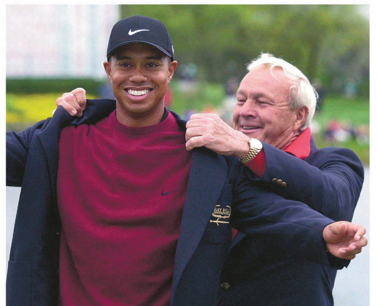
Palmer avec Tiger Woods, en 2001

« Je suis content d'avoir pu accomplir autant de choses au golf », a dit Palmer en 2008, deux ans après sa dernière participation officielle à un tournoi. Mais j'aimerais pouvoir penser que mon héritage