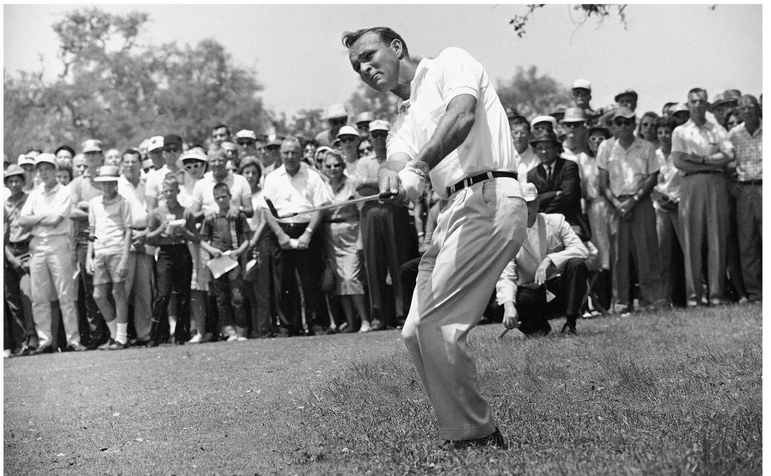
Arnold Palmer en pleine action à l'Open du Texas de 1962