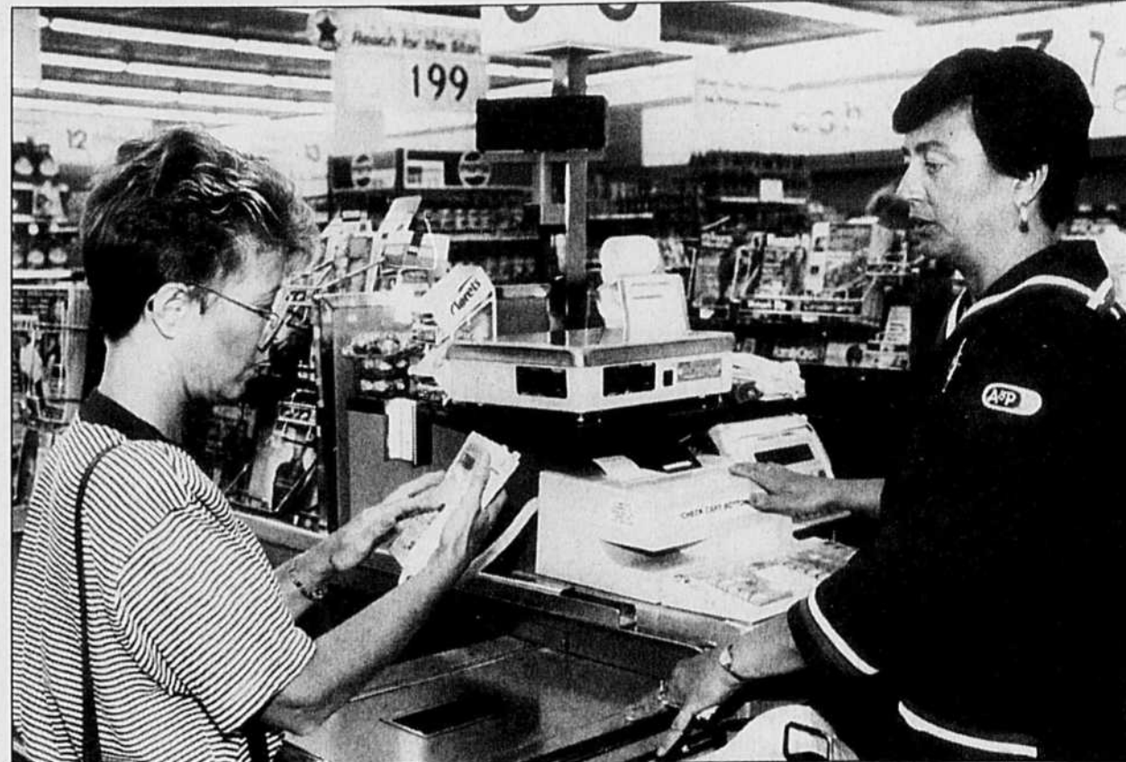
L'utilisation d'une carte de débit est une commodité dont doivent malheureusement se priver la plupart des analphabètes.

Le point de vue des entrepreneurs dans tout cela? Ils constatent que leurs employés ont développé une confiance en eux-mêmes, qu'ils démontrent de la polyvalence — un atout pour le recrutement du personnel à l'interne — s'absentent moins, déchiffrent les consignes de sécurité, et comprennent mieux leur rôle dans l'entreprise.