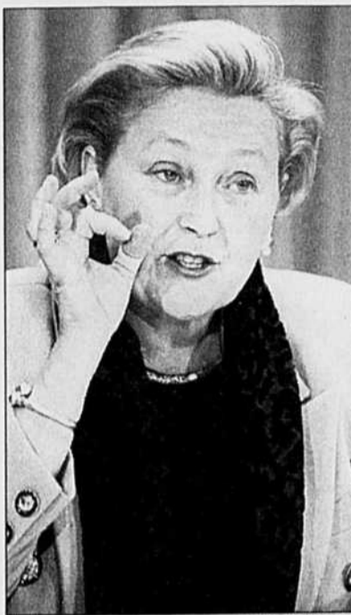
Le maintien des capacités de lecture chez les jeunes fait partie des priorités de Pauline Marois.

Le cadre de la formation étant un domaine exclusivement réservé aux provinces, les fonds alloués par le fédéral dans le cadre du Programme d'initiatives fédérales-provinciales conjointes en alphabétisation (entiè-