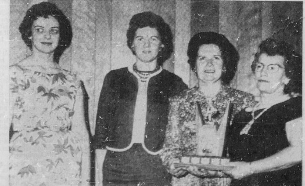
TROPHEE SPOONER — La présentation des trophées aux dames du club de curling de Sturgeon Falls a eu lieu la semaine dernière, lors de l'assemblée et du banquet annuels qui eurent lieu à l'hôtel King Edward. La photo nous fait voir l'équipe qui a remporté le tro-

Les fonctionnaires du ministère des Terres et Forêts de la province attribuent tous ces feux à la négligence.