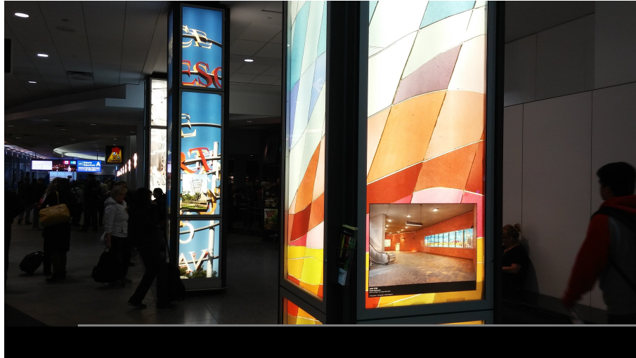
Figure 4. Art en Couleurs display with Sans Titre by Pierre Osterrath (a mural at Du Collège Metro station) in the foreground