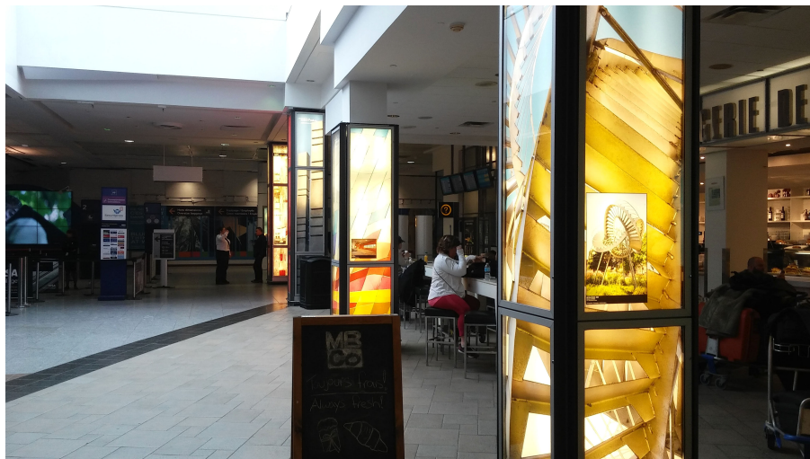
Figure 1. Art en Couleurs display with Révolutions by Michel de Broin (installed by Papineau Metro station) in the foreground

Photographically, each work is represented through dramatic close-ups, featuring small inserts with more conventional installation shots, and captions identifying the works' various sites across the city. The columns thereby include a pattern of fragmented forms and variegated geometric abstractions. As Caroline Bergeron, the photographer for Art en Couleurs (Figure 1), has explained: "My approach is to feature these colours and shapes, take them out of their environment and bring them together in one place. Overly static works and colours that have become so familiar are reinvented in this place of arrivals and departures." (ADM, 2016a) Many of the columns, tellingly, re-present the context of other transit hubs where the works are located. For instance, viewers are drawn into the works underground at the Montréal Metro, through Mario Merola's Octavie (1976) featured at Charlevoix station, Lyse Charland Favretti's L'Éducation and Pierre Osterrath's Untitled (both 1982) installed at the Du Collège station, or .98 (2007) by Alex Morgenthaler at Henri-Bourrassa station. Other spaces known for their transitoriness include the Esplanade of Place des Arts and the Palais des Congrès, which are featured through, respectively, Luis Feito's Mairel No 1 (1978) and the much-reproduced Lipstick Forest (Nature Légère) (1999-2002) by the landscape design office of Claude Cormier + Associés.