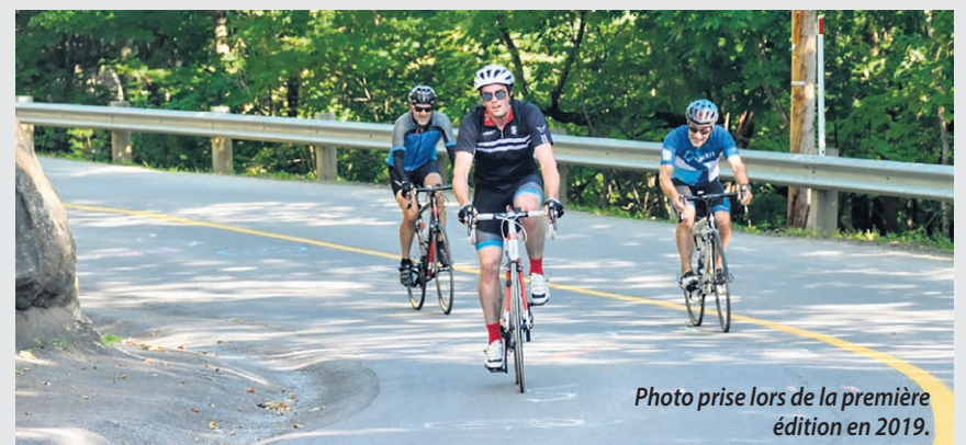
Photo prise lors de la première édition en 2019.

Pour sa deuxième édition, l'événement cycliste aura lieu dans la Municipalité de Piedmont sur le chemin de la Corniche le 16 août prochain de 9h à 12h. Il s'agit d'un circuit de 2,2 km reconnu par sa beauté tant au niveau de la route que par son parcours varié. Possédant un dénivelé d'un peu plus de 84 mètres, cette montée s'allonge sur 1 200 mètres et présente une inclinaison moyenne de 7% et une pointe de 11%.