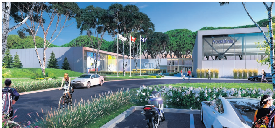
Voici la maquette d'un possible centre de tennis intérieur à Saint-Jérôme.

Luc Robert - La société Centre de tennis international de Saint-Jérôme (CTI) entend poursuivre ses démarches auprès d'un représentant de la municipalité, dans le dossier de la possible construction d'un centre de tennis intérieur à Saint-Jérôme.