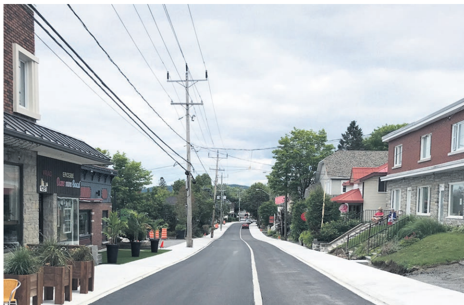
La rue Valiquette à Sainte-Adèle.

À Sainte-Adèle, la mairesse remarque un tourisme de proximité important alors que