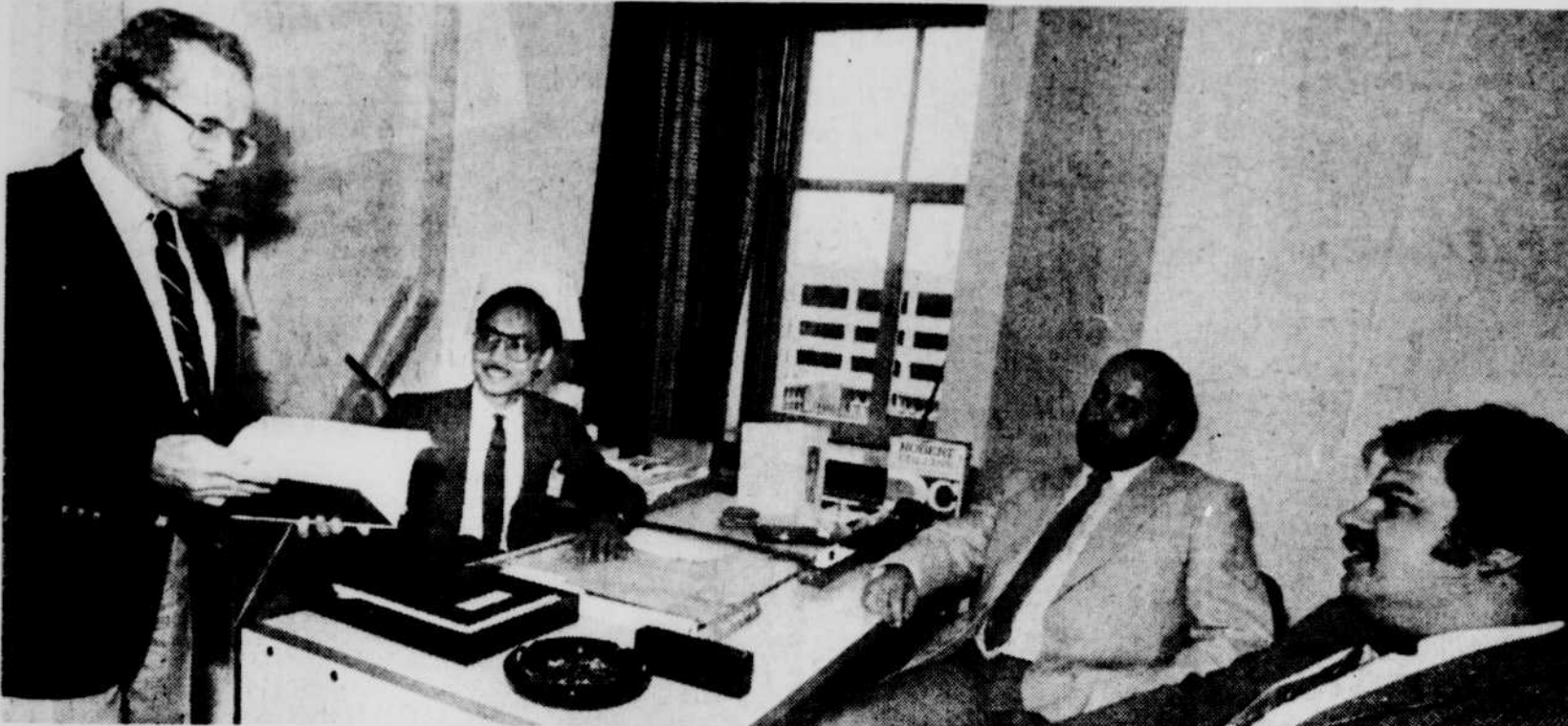
Les quatre spécialistes de la radiotélévision des débats à l'Assemblée nationale, qui ont décrit pour les fins de ce cahier thématique les tout derniers développements technologiques en vidéo-