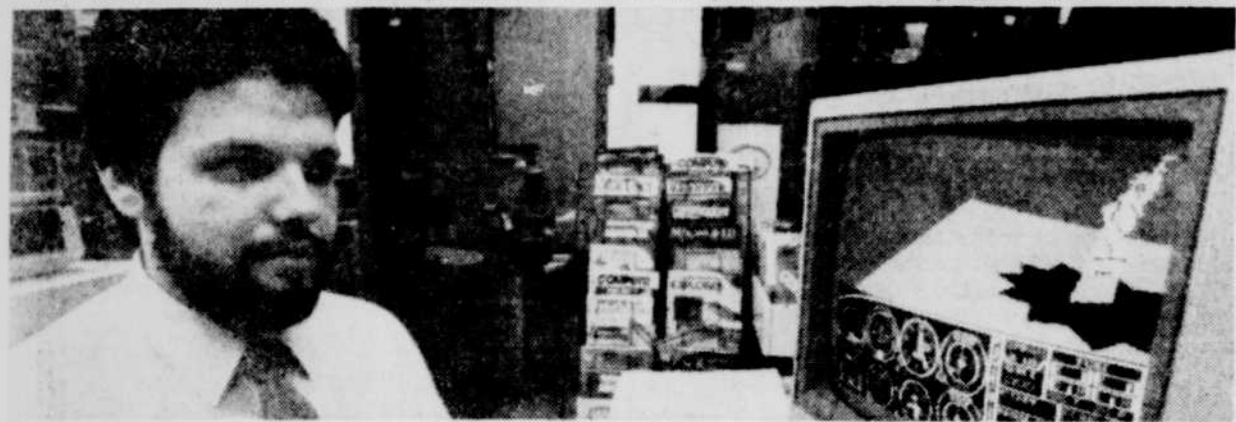
Jocelyn Corriveau a pris goût au pilotage après avoir maîtrisé le "flight simulator II" et s'est inscrit à des cours "pour de vrai". Il en est rendu à piloter en solo.

Un seul inconvénient, cependant, pour les puristes: ce divertissement n'a pas encore goûté à la loi 101... il n'existe qu'en anglais.