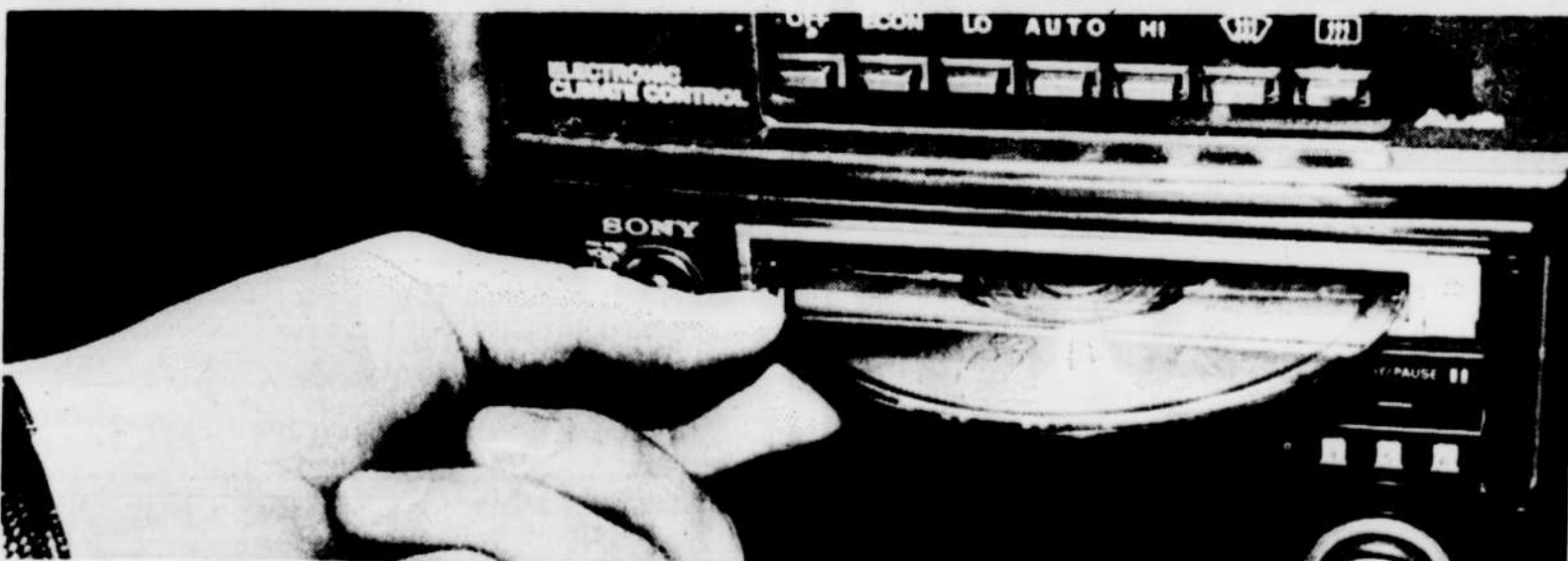
Une autre révolution dans le domaine du vidéo-son, le disque compact / laser, devient utilisable dans votre pièce de musique,