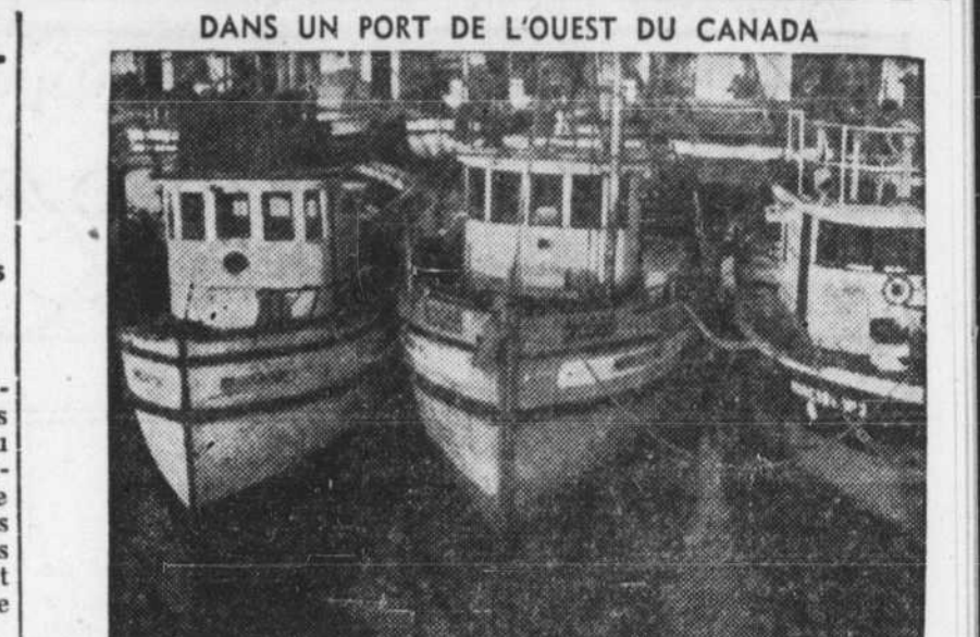
DANS UN PORT DE L'OUEST DU CANADA Tout comme les pêcheurs sur le St-Laurent, la Baie des Chaleurs ou sur l'Atlantique, ceux de la côte du Pacifique assurent au pays des revenus considérables. La présente photo, extraite du documentaire "Au Seuil du Pacifique" produit par l'Office National du Film, nous montre une partie de la flotte au repos dans un port de la Colombie.

Ce groupe ne comprend pas les 80 cas d'hôpital qui demeureront à Manille jusqu'à l'arrivée aux Philippines d'un navire-hôpital canadien. Trente-deux autres Canadiens attendent pour être transportés par avion. Samedi, plus de trois cents Canadiens subirent leur examen médical, 90 ont reçu de nouveaux vêtements et 80 ont passé à l'interrogatoire par lequel on complètera leurs dossiers et au cours duquel chaque prisonnier libéré peut assouvir sa vengeance en donnant des détails complets sur ce qui s'est passé dans les camps et en révélant l'identité des responsables et des criminels de guerre. Plus de 400 autres prisonniers, dont plusieurs malades, ont été reçus à Manille, à la section canadienne, où on les a habillés et où on leur a donné les premiers soins.