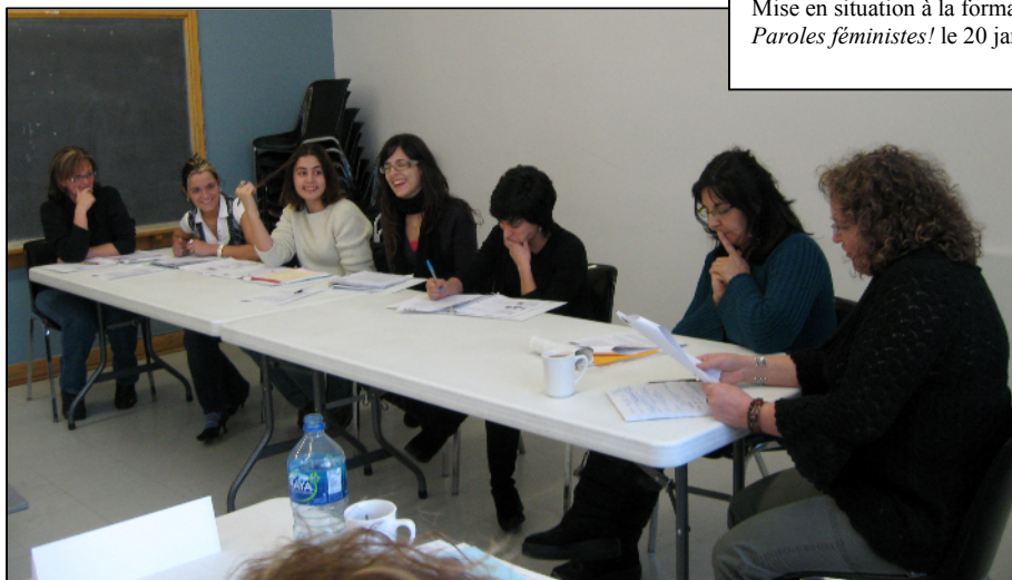
Mise en situation à la formation aux membres Paroles féministes! le 20 janvier 2009