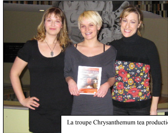
La troupe Chrysanthemum tea productions