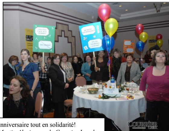
Un 20 ème anniversaire tout en solidarité!