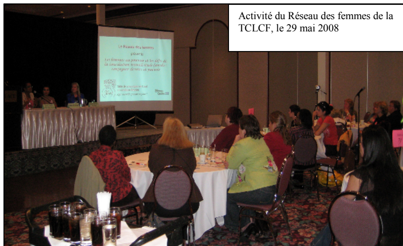
Activité du Réseau des femmes de la TCLCF, le 29 mai 2008