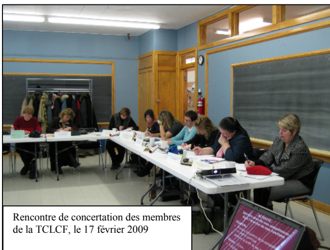
Rencontre de concertation des membres de la TCLCF, le 17 février 2009

En tant que regroupement régional de défense collective des droits des femmes, la TCLCF travaille en concertation avec ses membres pour l'amélioration des conditions de vie des Lavalloises. C'est ce qu'on appelle la vie associative. La concertation avec les membres est essentielle pour la TCLCF, puisqu'elle lui permet, d'une part, d'être en contact avec les réalités du milieu et, d'autre part, permet aux membres d'être au fait des enjeux en condition féminine en lien avec la conjoncture social et économique du moment.