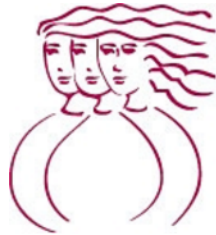
Table de concertation de Laval en condition féminine