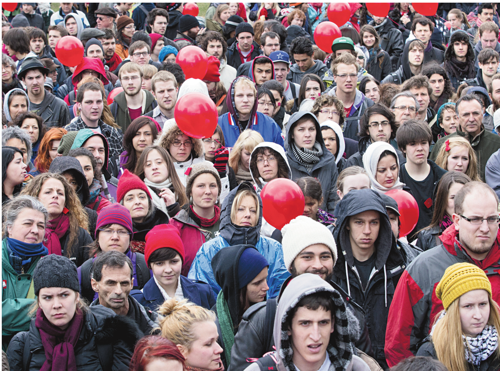
Un rassemblement organisé par l'ASSE lors du Printemps érable. L'Association, qui prendra part au Forum social des peuples, croit que « les jeunes doivent demeurer alertes à ce qui se passe et réagir aux attaques néolibérales contre nos services publics ».