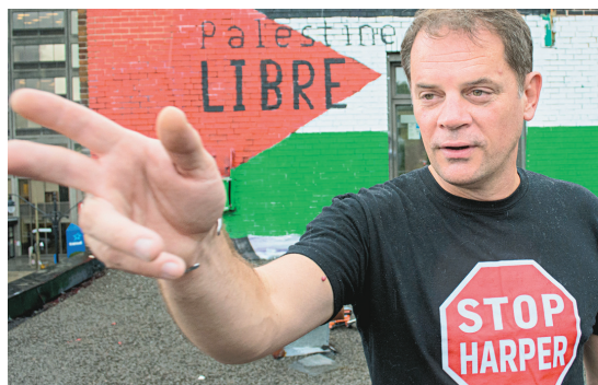
MICHAEL MONNIER LE DEVOIR

Un deuxième Forum social québécois s'est tenu en 2009. Cet événement s'est inscrit dans la mouvance des Forums sociaux mondiaux, dont fait aussi partie le Forum social des peuples du Canada.