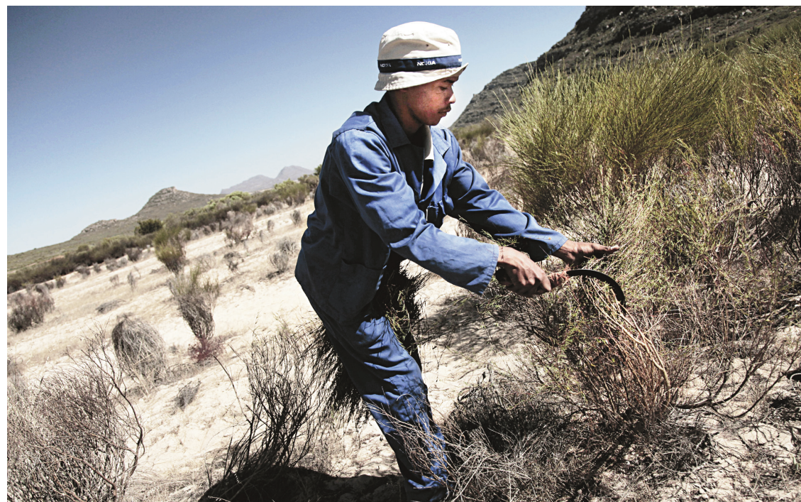
NATHALIE BARDIN AGENCE FRANCE-PRESSE

« Un changement réel dans une société peut seulement venir de la base, affirme-t-il. Rien n'est plus fort que les citoyens qui se mettent ensemble. Tant que chacun est chez soi, devant sa télévision, peu de choses se passent. Ce genre d'événement est très important pour développer des communautés d'intérêt.