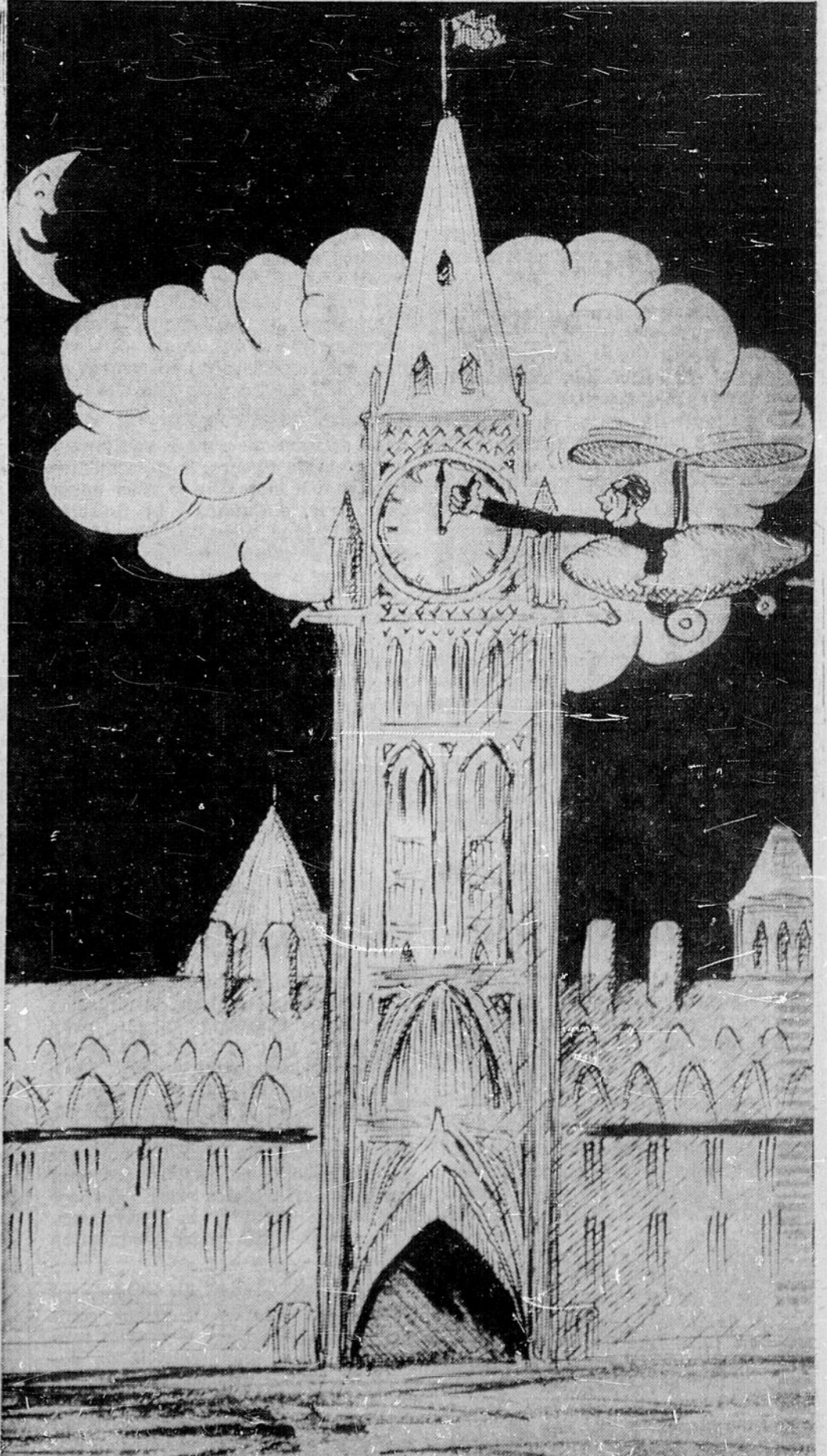
N'oubliez pas d'avancer vos horloges d'une heure, samedi, à minuit. (Caricature Henri Lepersier)

VOIR AUTRES NOUVELLES DU NORD EN PAGES 3, 13 et 20