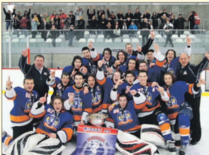
Les joueurs viennent de recevoir leur bannière de champions du tournoi de Beauport.

Les Gladiateurs occupent actuellement le 6 e rang de la ligue comptant 10 équipes avec un pourcentage d'un peu plus de .500. ■