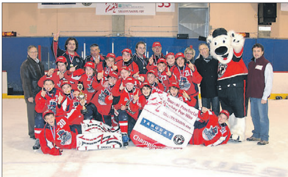
Les Gouverneurs de la Rive Nord décrochent le trophée Tanguay/Remparts de Québec, emblème de la classe AA.