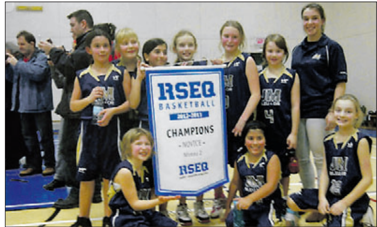
L'équipe de minibasket AA a remporté la médaille d'or du championnat régional.

Finalement, l'équipe de minibasket novice a aussi récolté la bannière du championnat régional, en plus de recevoir une médaille de bronze. ■