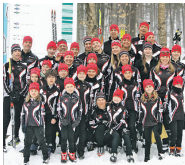
Le Club de ski de fond Hus-ski regroupe une soixantaine de skieurs, adeptes de la glisse du secteur Ouest de la région de Québec.

Le Club de ski de fond Hus-ski regroupe des adeptes de la glisse du secteur Ouest de la région de Québec. Une soixantaine de skieurs âgés de 4 à 70 ans se retrouvent de une à trois fois par semaine à la station touristique Duchesnay pour parfaire leurs techniques des styles classiques et pas de patin. La compétition au sein du Circuit régional JH-Lamontagne est encouragée, les Hus-ski ont d'ailleurs récolté six autres médailles au cours de cette compétition, mais c'est surtout l'effort, la persévérance et l'engagement au sein du Club qui sont à l'avant-plan. ■