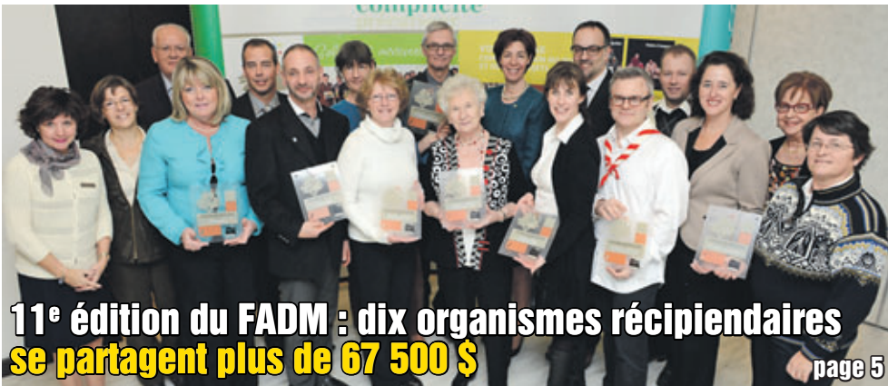
11 e édition du FADM : dix organismes récipiendaires se partagent plus de 67 500 $ page 5