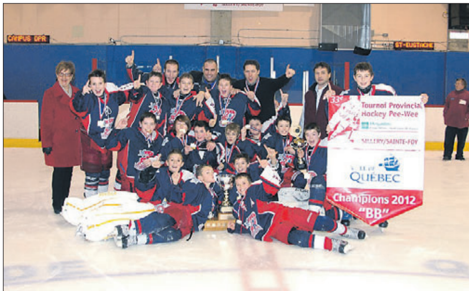
Les Patriotes de Saint-Eustache repartent avec le trophée Ville de Québec dans la catégorie BB.