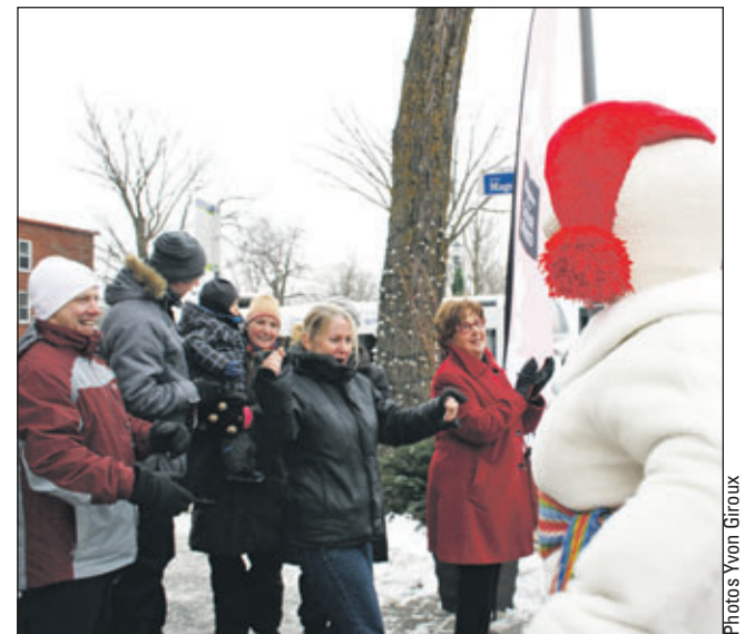
L'accueil réservé au Bonhomme Carnaval est toujours aussi enthousiaste.