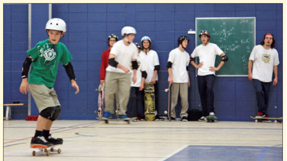
Le Séminaire des Pères Maristes participe au volet parascolaire de QcSkateboardCamp.

Pour plus d'information sur leur service de parascolaire en skateboard : 418 655-2267. ■