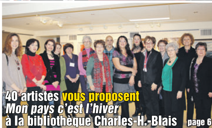
40 artistes vous proposent Mon pays c'est l'hiver à la bibliothèque Charles-H.-Blais page 6