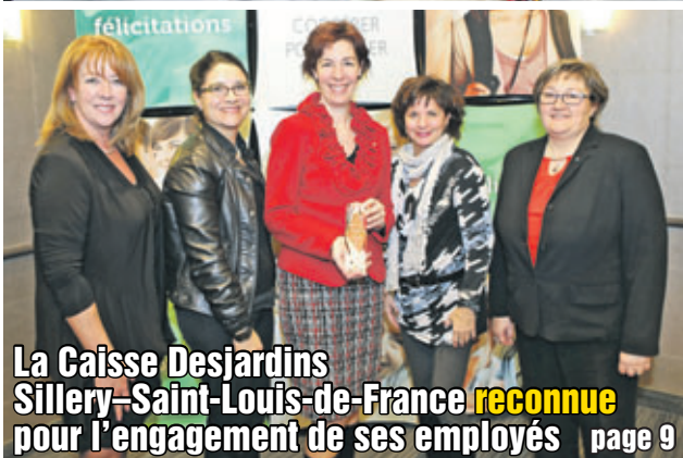
La Caisse Desjardins Sillery-Saint-Louis-de-France reconnue pour l'engagement de ses employés page 9