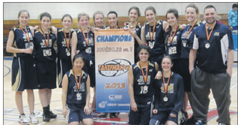
L'équipe juvénile a remporté la bannière du tournoi Tekefman.