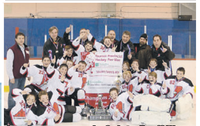
Les Gouverneurs de Sainte-Foy/Sillery remportent le Tournoi Pee-Wee de Sillery-Sainte-Foy page 12