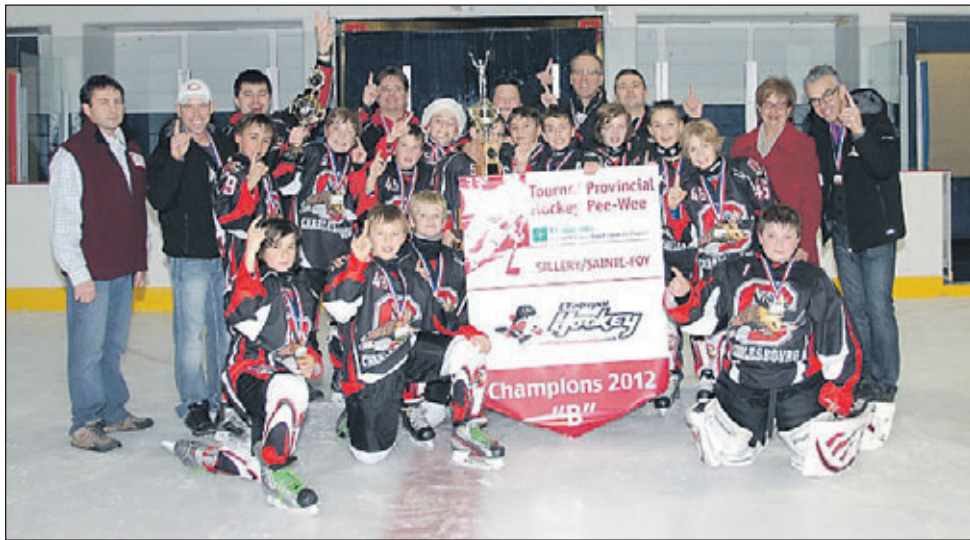
Photo, Classe « B », Les Caribous de Charlesbourg sont les champions de la classe B et remportent le trophée Entrepôt du hockey.