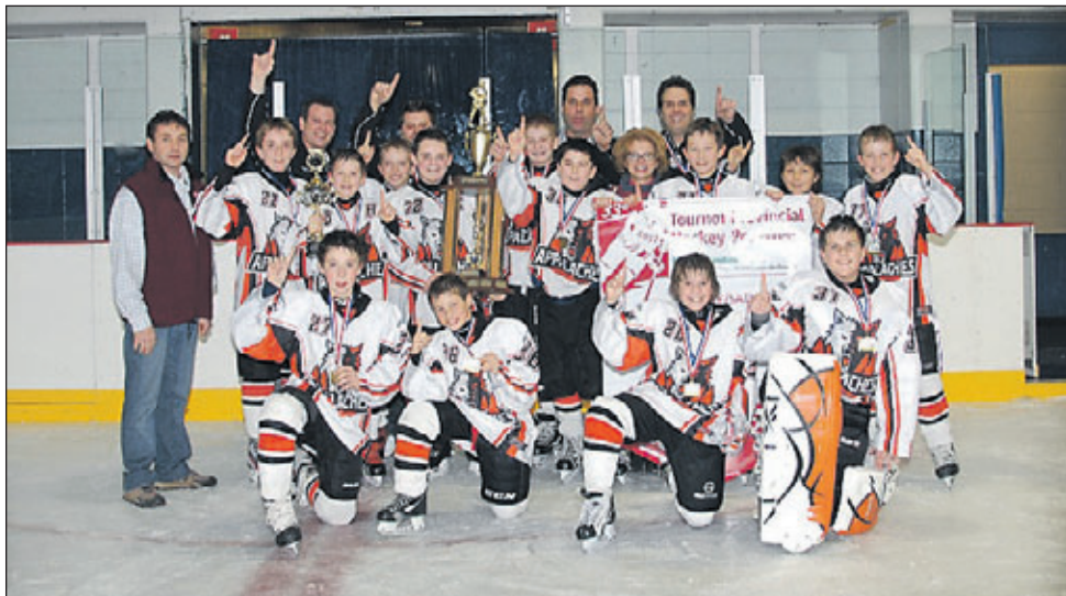
Photo Classe « A », L'équipe Appalache 1 de Thetford Mines remportent le championnat de la classe A et le trophée Construction José.

Pour la 14 e année, le tournoi accueillait en plus des classes A, B, BB, CC, six équipes de la classe AA de la Ligue de hockey développement. L'équipe championne de cette catégorie, Les Gouverneurs de la Rive-Nord représentera les Petit Remparts dans le tournoi International de Québec, en février 2013. ■