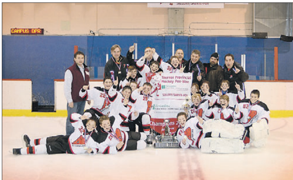
Les Gouverneurs Sainte-Foy / Sillery remportent le trophée Caisse Desjardins Sillery/Saint-Louis de France de la classe CC.