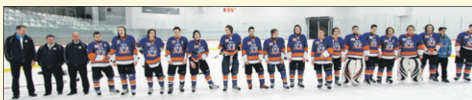
Les joueurs viennent de remporter la victoire et s'alignent pour recevoir leurs récompenses. À l'arrière, le pointage de 9 à 1 sur le tableau d'affichage indique que la partie s'est déroulée à sens unique.