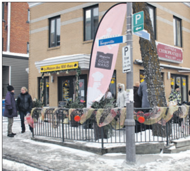
Un peu plus de 300 personnes sont passées à la Maison des 100 théés pour participer au Maguire Gourmand.