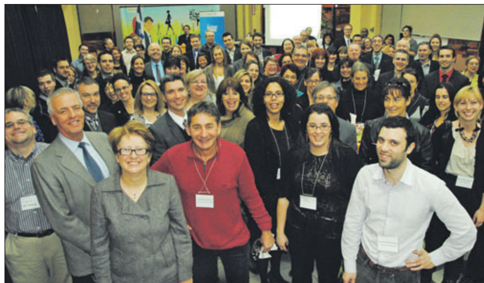
Une partie des participants au 5 à 7 Trucs et Astuces.