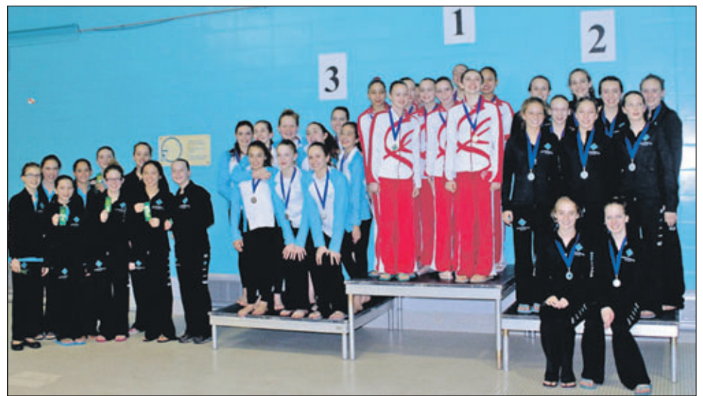
SynchroÉlite a reçu la médaille d'argent dans les catégories 13-15 ans.

Pour ce qui est des routines d'équipe, SynchroÉlite a reçu la médaille d'or chez les 12 ans et moins et la médaille d'argent dans les catégories 13-15 ans et Junior.