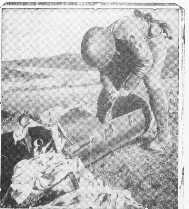
Les soldats allemands ont capturé un soldat britannique qui participait à la prise d'une ferme défendue avec acharnement par les Allemands, en Tunisie. A la prise de la forteresse improvisée, les Anglais découvrirent 16 commandos blessés, gardés prisonniers dans l'enceinte. On voit dans la photo un soldat britannique examinant un contenant de métal qui servit à jeter d'un avion, à l'aide d'un parachute, les armes nécessaires à la poursuite de la défense allemande de ce domaine tunisien.