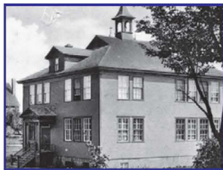
Édifice de la Légion - Legion Hall

L'édifice de la Légion canadienne – Construit en 1922, ce bâtiment servit d'école primaire française jusqu'en 1955. La Légion canadienne acheta l'édifice en 1962 et le CLSC et le Centre d'action communautaire ont occupé les lieux jusqu'en 2008. Un nouvel édifice, respectant l'apparence de l'ancienne structure, fut inauguré en 2010.