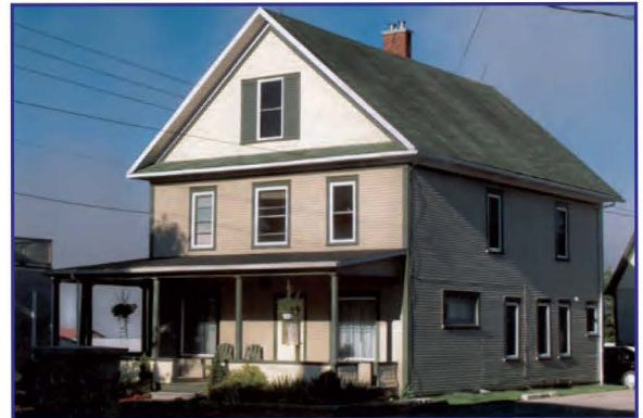
La maison Giroux

Observe the stately residences facing each other at 284 and 283 Main St , on the other side of the street.