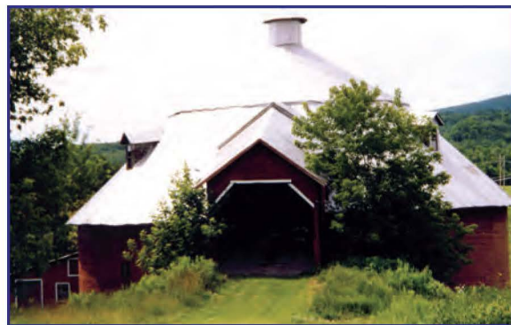
La grange ronde – The round barn