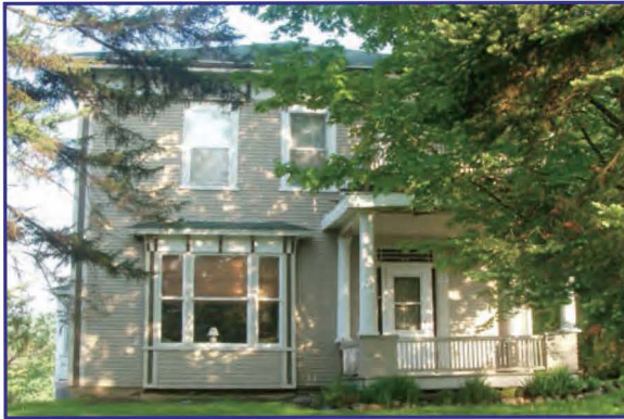
283, rue Principale

En contournant l'hôtel de ville en direction sud, on voit sur la rue Principale l'édifice de la banque et deux superbes résidences d'époque se faisant face.