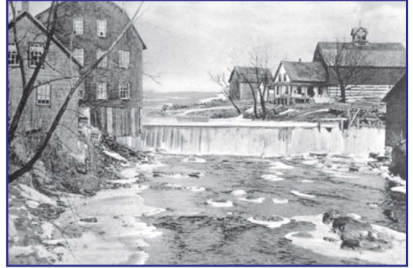
Place du moulin