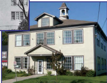
Édifice CLSC - CAB 2010