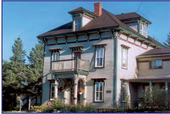
La maison Manson