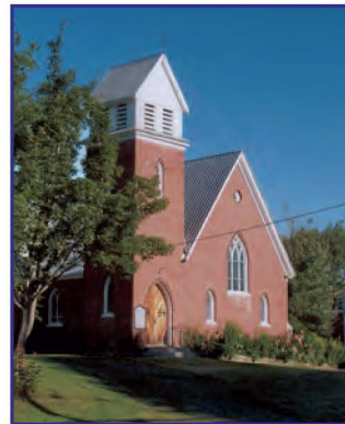
L'église anglicane St. Paul Anglican Church