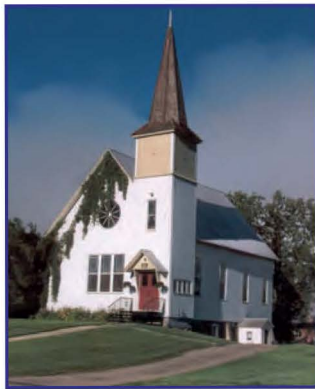
L'église unie – United Church

Quatre églises d'époque, qui témoignent de l'héritage multi-confessionnel de la population de Potton, bordent la rue Principale. Elles ont fait l'objet d'une étude approfondie dans une brochure de la MRC de Memphrémagog traitant du patrimoine religieux de la région. On peut se procurer cette brochure au bureau d'accueil touristique.