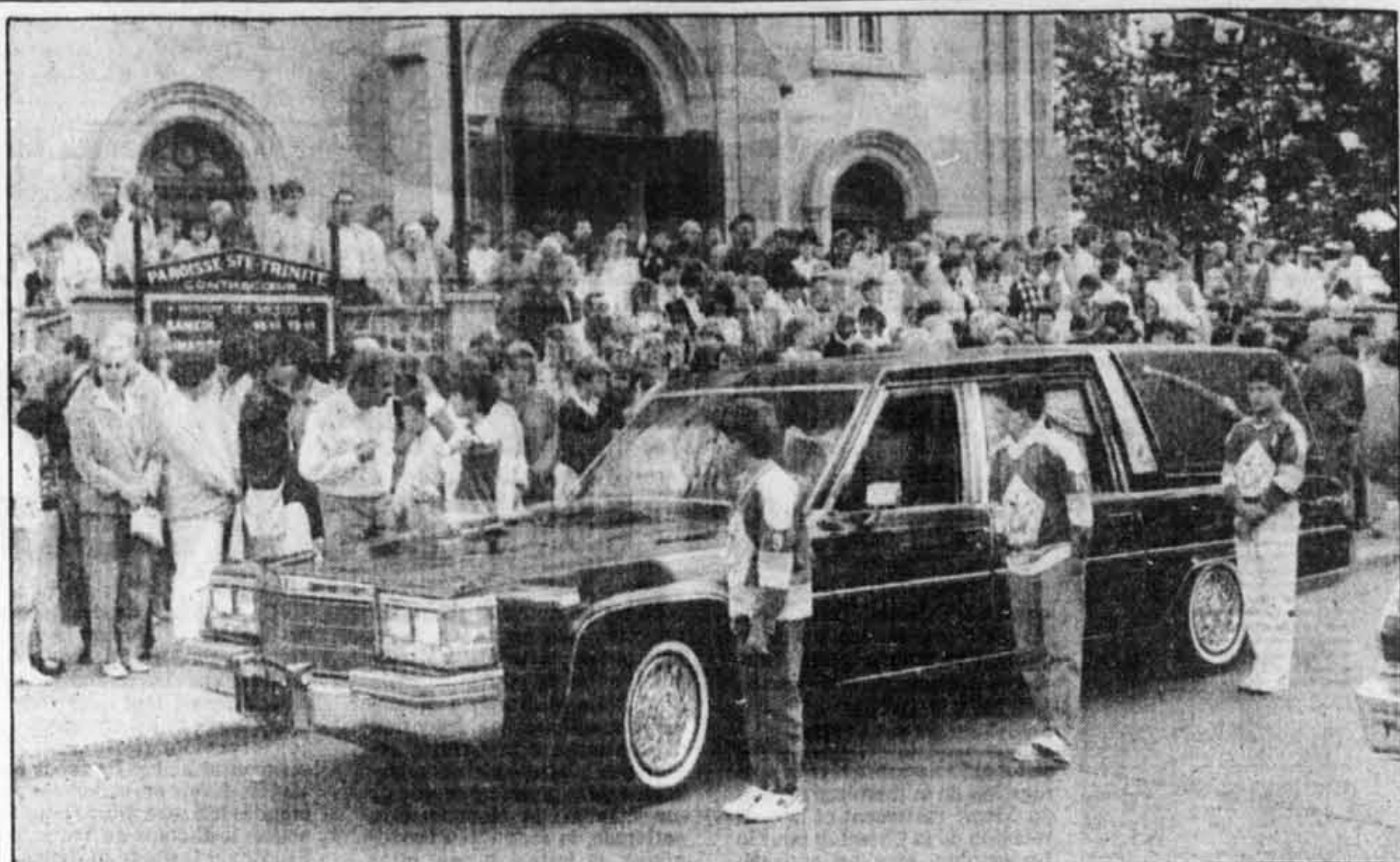
L'arrivée du cortège funèbre

■ M. Mulroney profitera de l'allègement de ses tâches au Parlement pour sillonner davantage le pays et se concentrer sur quelques grands dossiers comme le libre-échange, la réforme constitutionnelle et les grands sommets internationaux.