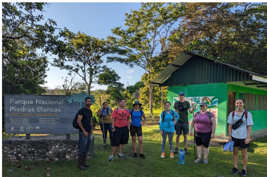
Figure 1. Prêts pour l'aventure! Parc national Piedras Blancas, Costa Rica

Prunier, D. et Salazar, S., traduction de l'espagnol par Cappelle, C. (2022). Fractures, frontières et mobilités centro-américaines face au covid . Dans Duterme, B. (dir.), Fuir l'Amérique centrale . (p. 45-63). Éditions Syllepse. https://doi.org/10.3917/syll.cetri.2022.01.0045