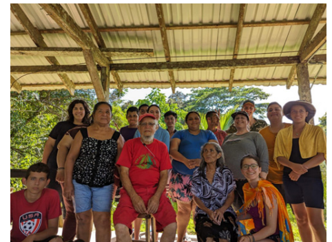
Figure 1. Un jour de l'amitié ensoleillé Cataractas, Costa Rica.

ficativement différente, ce qui expliquerait la contradiction. Notamment, dans une des entrevues, un répondant m'a dit qu'il y a beaucoup de problèmes dans la capitale qui sont reliés au grand nombre de migrants. Deuxièmement, le fait que le texte ne traite que de l'opinion sur les Nicaraguayens peut interférer, puisque mes questions portaient sur des migrants de toutes origines confondues.