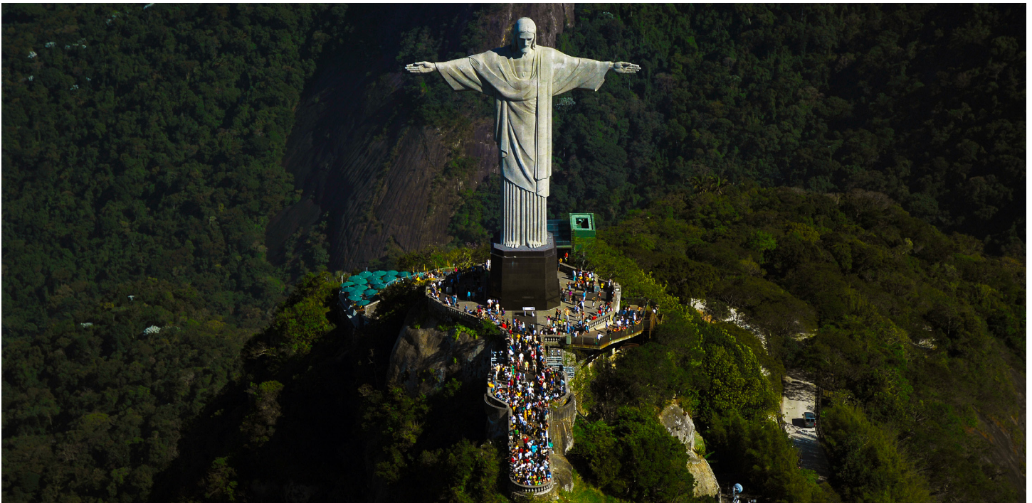
Figure 1 - Le Christ rédempteur de Rio de Janeiro, sur le Corcovado © 2020, par Mucio Scorzelli /Wikipédia Communs. CC BY-SA 4.0