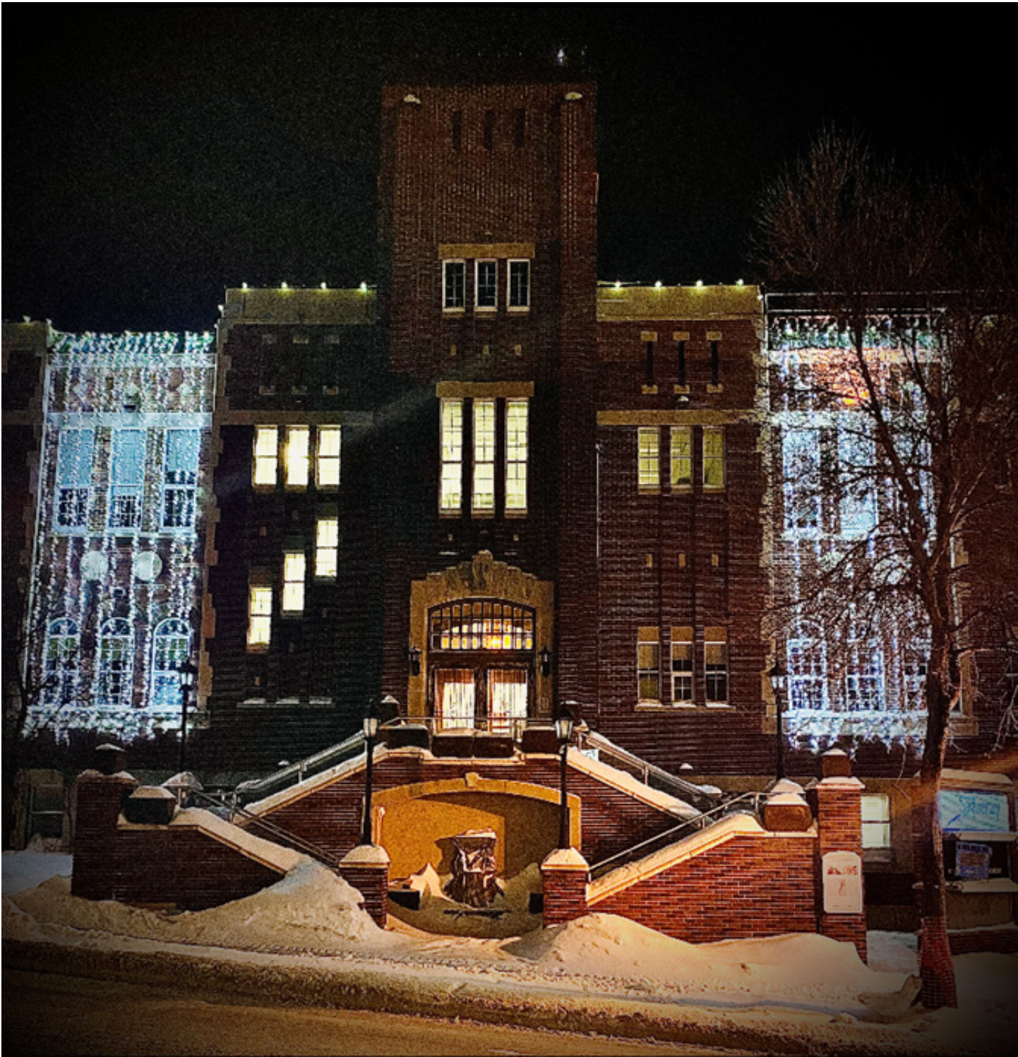
Ancien hôtel de ville de Jonquière