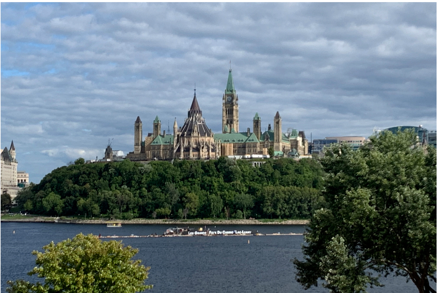
Figure 2 – Parlement du Canada à Ottawa.

En conclusion, il est possible de remarquer que la religion a de l'influence au point de vue de la politique au Brésil et au Canada. Que ce soit par l'État laïque, les politiciens et les projets de loi, les symboles religieux ou la situation actuelle, la religion chrétienne est présente en politique. Toutefois, en comparant la situation du Canada et celle du Brésil, on peut voir que l'influence de la religion n'est pas la même pour ces deux pays. Au Brésil, la religion chrétienne a énormément d'influence, car le système politique est imprégné de symboles et d'hommes politiques religieux. Au Canada, l'influence de la religion chrétienne est plus discrète et provient plus souvent de vestiges religieux. Ainsi, il est possible de fournir une réponse à notre question : la religion peut influencer un système politique laïque comme celui du Brésil et du Canada, mais cette influence varie.