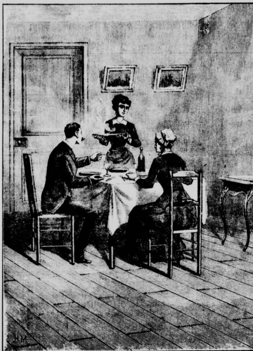
Bientôt nos trois personnages furent assis autour de la table étroite. —(Voir page 101, col. 3)

Jeanne pleurait de joie. Elle était heureuse. Etrange bonheur qui ne pouvait se manifester que par les larmes !