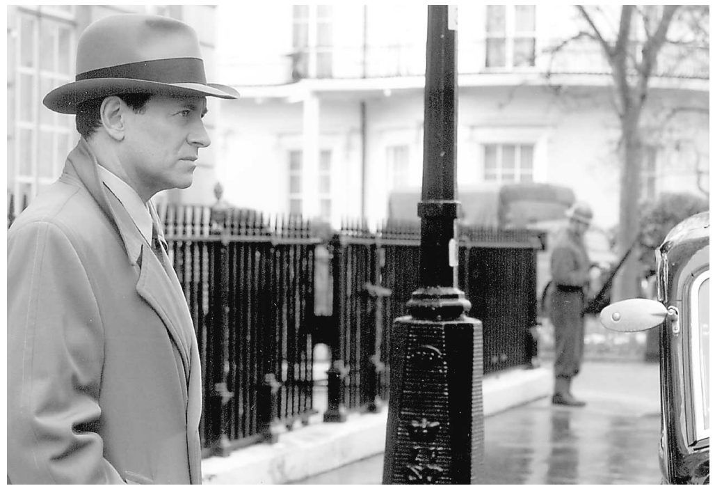
Francis Huster interprète le héros de la Résistance française Jean Moulin, dans la série du même nom qui sera présentée les dimanches 1 er et 8 décembre à Super Écran.