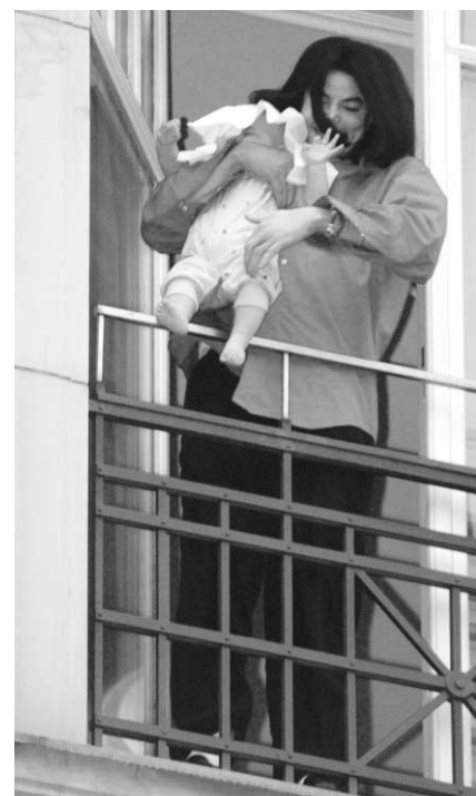
Michael Jackson tenant son bébé au-dessus du vide sur le balcon d'un hôtel de Berlin, mardi.

Michael Jackson doit recevoir aujourd'hui le prix allemand des médias « Bambi » pour l'ensemble de son oeuvre et achever demain sa visite en Allemagne.