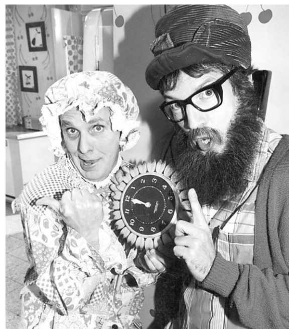
Au Québec, les séries américaines traduites ont été supplantées par des productions locales comme La Petite Vie .

Or il est fort difficile de créer des vedettes au Canada anglais puisque du moment qu'elles ont un peu de reconnaissance, elles filent s'établir sous le soleil de la Californie. C'est le constat auquel sont arrivés les gens de Téléfilm Canada, qui, eux, travaillent à construire un public canadien pour les films canadiens. Jusqu'à présent, leurs efforts ont été vains.