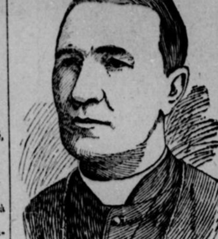
S. G. MGR GRAVEL

te et proposa la santé de la Reine et l'orchestre joua "God save the Queen."