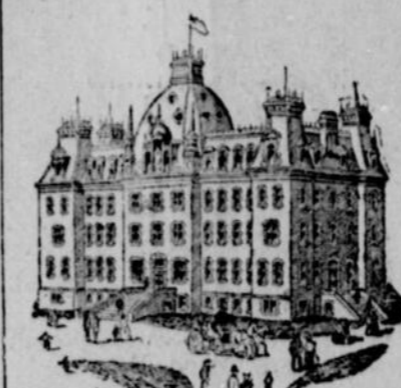
COLLÈGE DU MONT ST-BERNARD A Sorel.