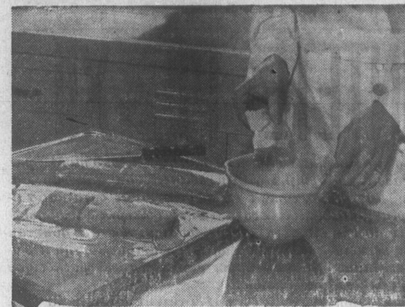
FILETS DE POISSON CANADIEN ROULES

Ce sont les petits détails qui font le diner. C'est vrai! Prenez, par exemple, ces filets de sole canadienne farcis et roulés. C'est un plat très facile à préparer, et des plus avantageux pour le diner. Choisissez les filets de sole rapidement congelés, qu'on vend sous enveloppe transparente étanche. Les filets de poisson canadien sont maintenant congelés dans leur enveloppe protectrice, par un procédé nouveau qui les soumet à une température extrêmement basse, dès après la pêche. Cette congélation rapide diffère entièrement des procédés frigorifiques en usage jusqu'ici, en ceci surtout: que les cristaux de glace sont brisés ou altérés. Les filets sont prêts à employer, tout nettoyés et sans arêtes. Ne faites pas dégeler les filets congelés avant de les employer, car la décongélation préalable les exposerait à perdre leurs sucres nutritifs.