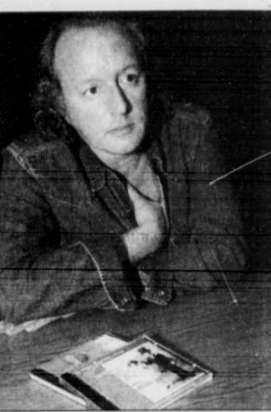
Didier Barbelivien a visité Québec pour la première fois cette semaine.

Plus habitué au studio qu'aux planches, il apprivoise peu à peu la scène, lieu qu'il trouve très excitant. «Il y a dix ans, j'aurais été paniqué», confie-t-il. Comme il est prolifique, il aura entretemps produit un autre album et écrit son second roman, l'expérience lui dictant de ne pas mettre tous ses oeufs dans le même panier.