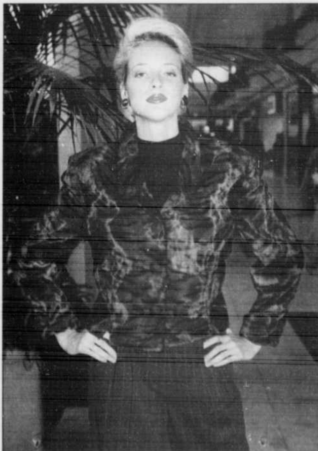
Veste en fausse fourrure imprimée panthère de la collection Jean-Claude Poitras. Boutique Mélanie-Lyne.

Cette saison, l'arrivée massive des imprimés animaliers stimule la mode qui se faisait résolument un peu trop classique aux cours des dernières années. Les motifs peaux de bêtes s'impriment autant sur des tissus fins que sur des matières veloutées qui prennent l'aspect de la fourrure. Comme cette impression est plutôt voyante lorsqu'on s'en revêt entièrement, on peut agencer cet imprimé en le combinant avec un vêtement de teinte unie. Pour celles qui ne désirent qu'une touche subtile, on propose des vestes garnies d'un col à motifs peaux de bêtes, ou encore une vaste gamme d'accessoires offerts dans ces impressions, qui permettent sans trop de frais de réactualiser sa garde-robe.