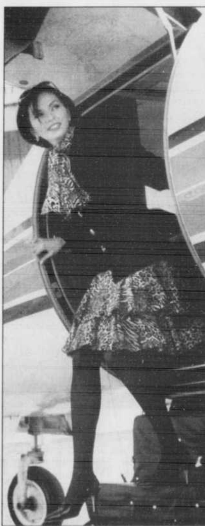
Impression fauve pour cette jupe rolantée et cette écharpe portées sur une veste en ottoman. Collection Joseph Ribkoff.