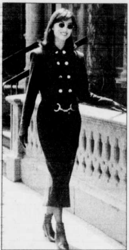
Tailleur à veste courte et longue jupe étroite.