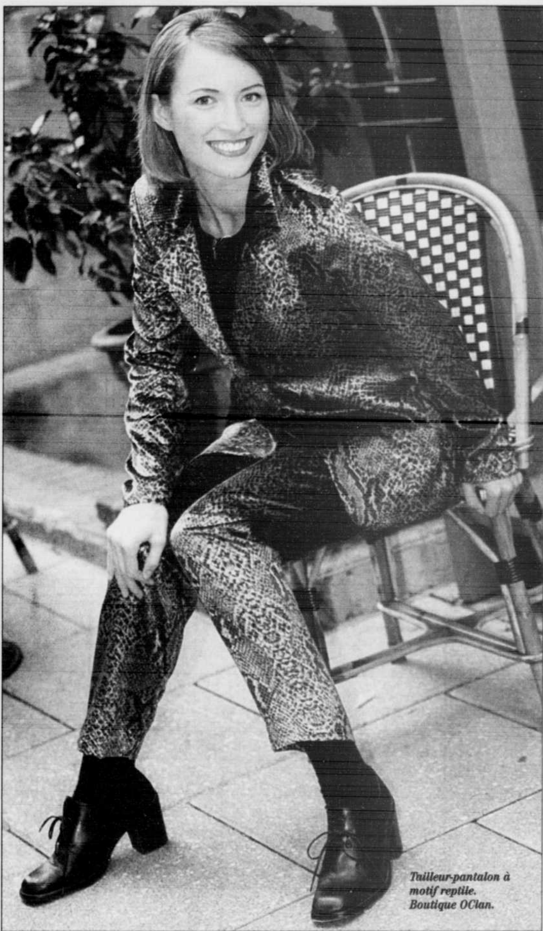
Tailleur-pantalon à motif reptile. Boutique OClan.