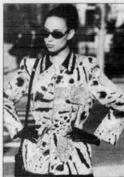
Costume à l'allure exotique.

« Cette saison, nous avons redessiné nos vestes de façon à ce qu'elles soient plus seyantes. Elles sont soit courtes et ajustées, soit longues et fluides, une