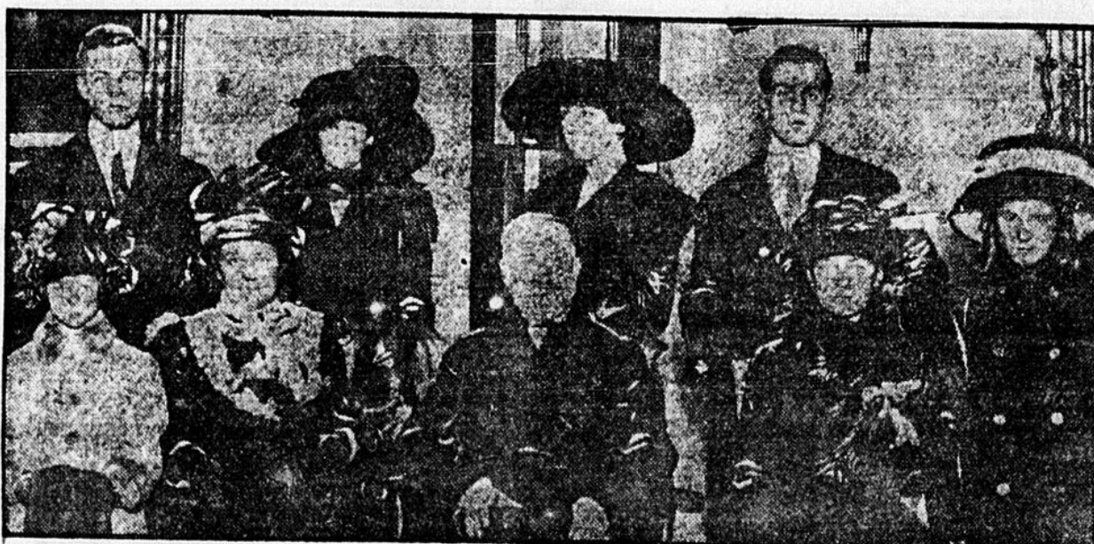
LE MAIRE GAYNOR, entouré des membres de sa famille. Cette photographie a été prise lors de son élection à la mairie de New-York.