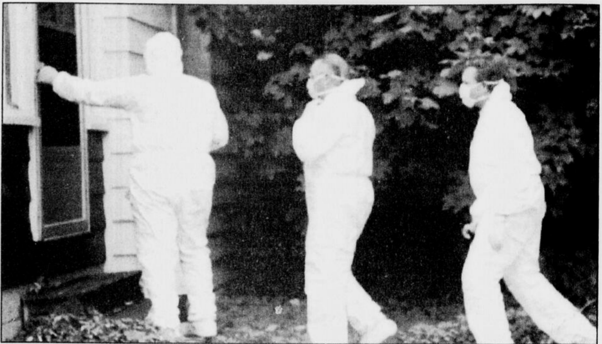
Le coroner et deux détectives font leur entrée dans la maison où ont été trouvés les cadavres, à Barrie, en Ontario.

«La bande contrôle la quasi-totalité des bars de danseuses nues au Québec», lit-on.