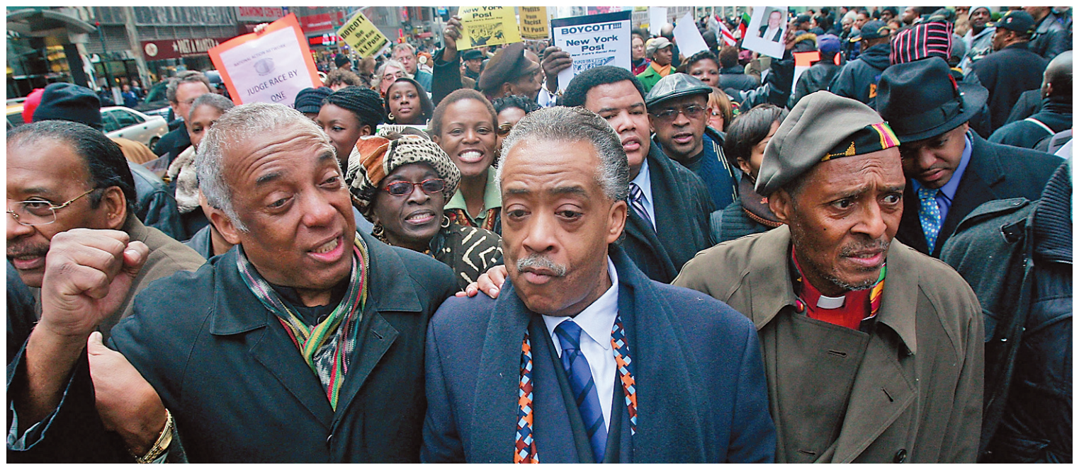
La communauté noire aux États-Unis continue à subir des préjudices.