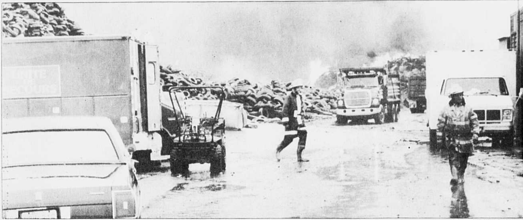
Des camions ont transporté toute la journée des chargements de sable.