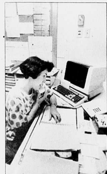
Au CLSC de Saint-Amable, on répondait toute la journée aux appels de citoyens inquiets.

Les autorités conseillaient encore hier de fermer portes et fenêtres si on demeurait près du brasier. Parmi les autres conseils à la population, on demandait que les animaux laitiers soient gardés à l'intérieur des bâtiments, surtout si le nuage de fumée venait à recouvrir les champs servant au pâturage.