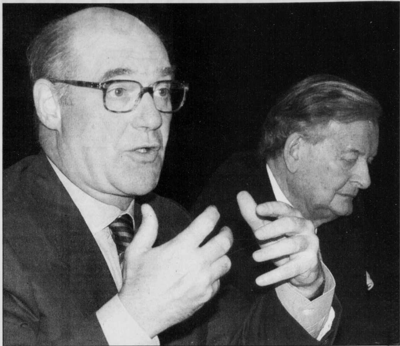
Le président du conseil de BCE, Jean Monty, savourait pleinement son heure de gloire vendredi lorsqu'il annonçait la conclusion d'une entente de fusion avec le président Ken Thomson, de l'empire qui portait son nom.

Que penser de la transaction de 4,9 milliards $ qui verra la Caisse de dépôt et de placement du Québec et Quebecor, propriétaire de journaux, du site Canoë et de TQS, mettre la main sur Vidéotron, géant de la câblodistribution et de la télévision avec le réseau