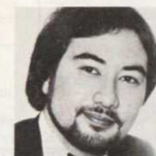
Jon Kimura Parker Colombie-Britannique