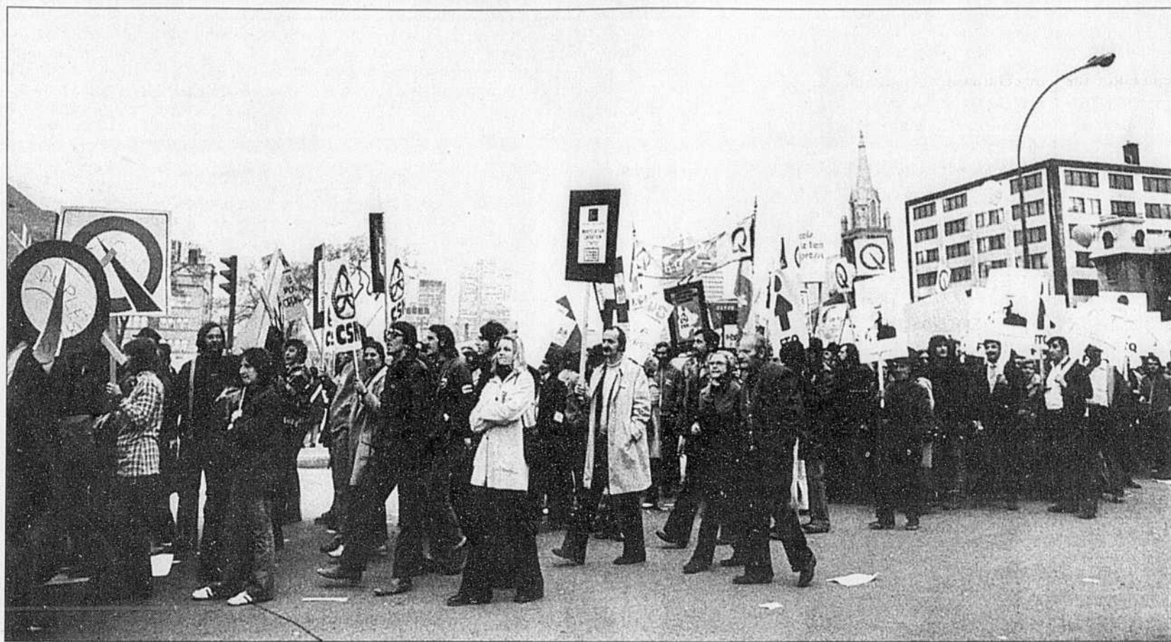
Une manifestation contre le gouvernement Bourassa en 1973. «Si le syndicalisme de combat des années 70 suivait une ligne simpliste et unilatérale, la stratégie actuelle, axée sur le partenariat, est l'envers aussi simpliste d'une même problématique dogmatique».

Le syndicalisme des années 70 en était un de combat et d'affrontement contre l'État keynésien et providen-