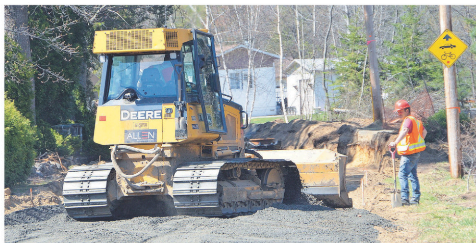
Le chantier du Lac-à-la-Tortue coûtera au final 51,9 millions$.

En résumé, le chantier du Lac-à-la-Tortue coûtera au final 51,9 millions$. Les gouvernements du Québec et du Canada avaient annoncé une aide maximale de 14,2 M$ pour le premier et de 21,5 M$ pour le second, c'est-à-dire de 35,7 millions$. La part de Shawinigan (1075 maisons) et de Hérouxville (197 maisons)