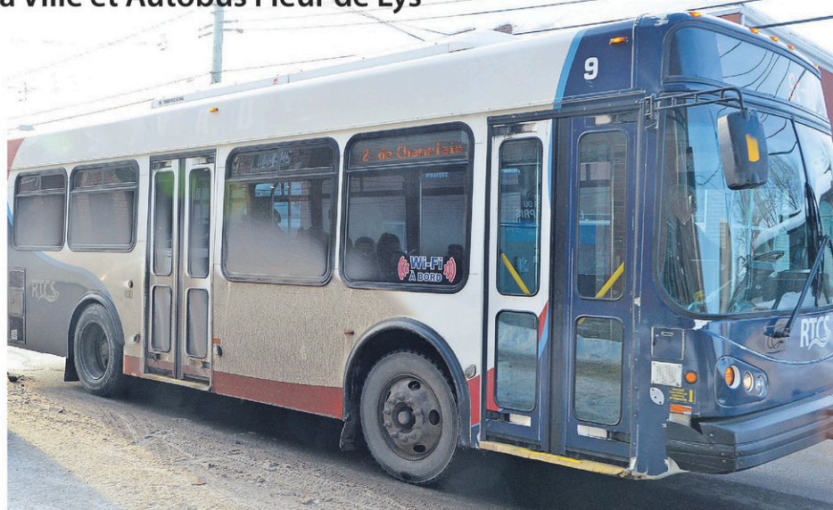
Autobus Fleur de Lys sera le nouveau transporteur pour le réseau de transport en commun à Shawinigan à compter du 1 er juillet prochain.

Dépendant des scénarios adoptés par la Ville, il en coûtera annuellement 1,876 M$ pour une flotte de quatre autobus (excluant les véhicules de réserve) pour une quantité d'heures variant de 16 316 à 23 799 heures, et le second scénario