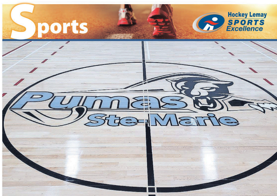
Les équipes sportives de l'école Ste-Marie se nommeront les Pumas.