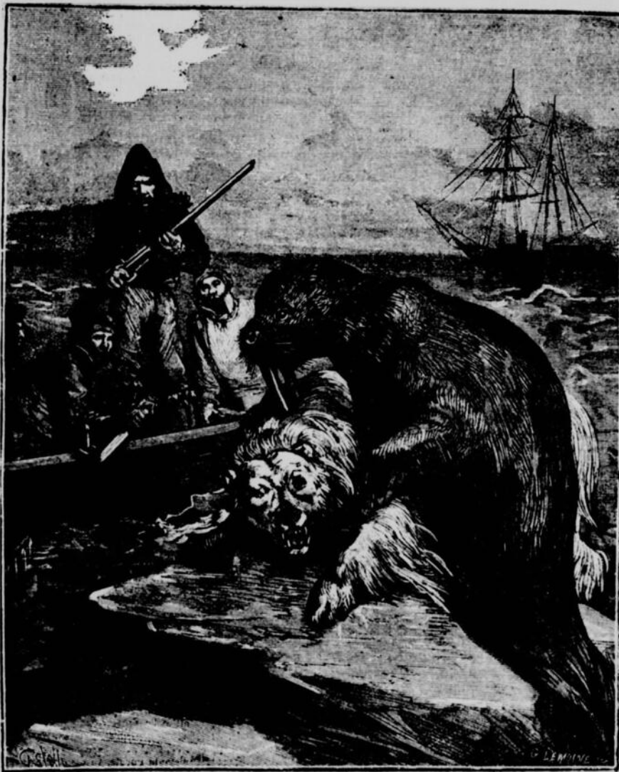
Elle enfonce ses puissantes défenses dans les chairs de l'ours. (Page 5, col. 3).

Puis le groupe disparaît subitement dans l'abi-