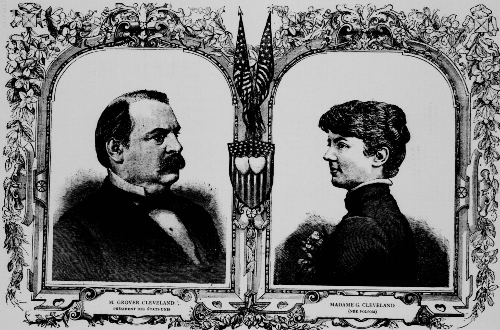
M. GROVER CLEVELAND PRÉSIDENT DES ÉTATS-UNIS