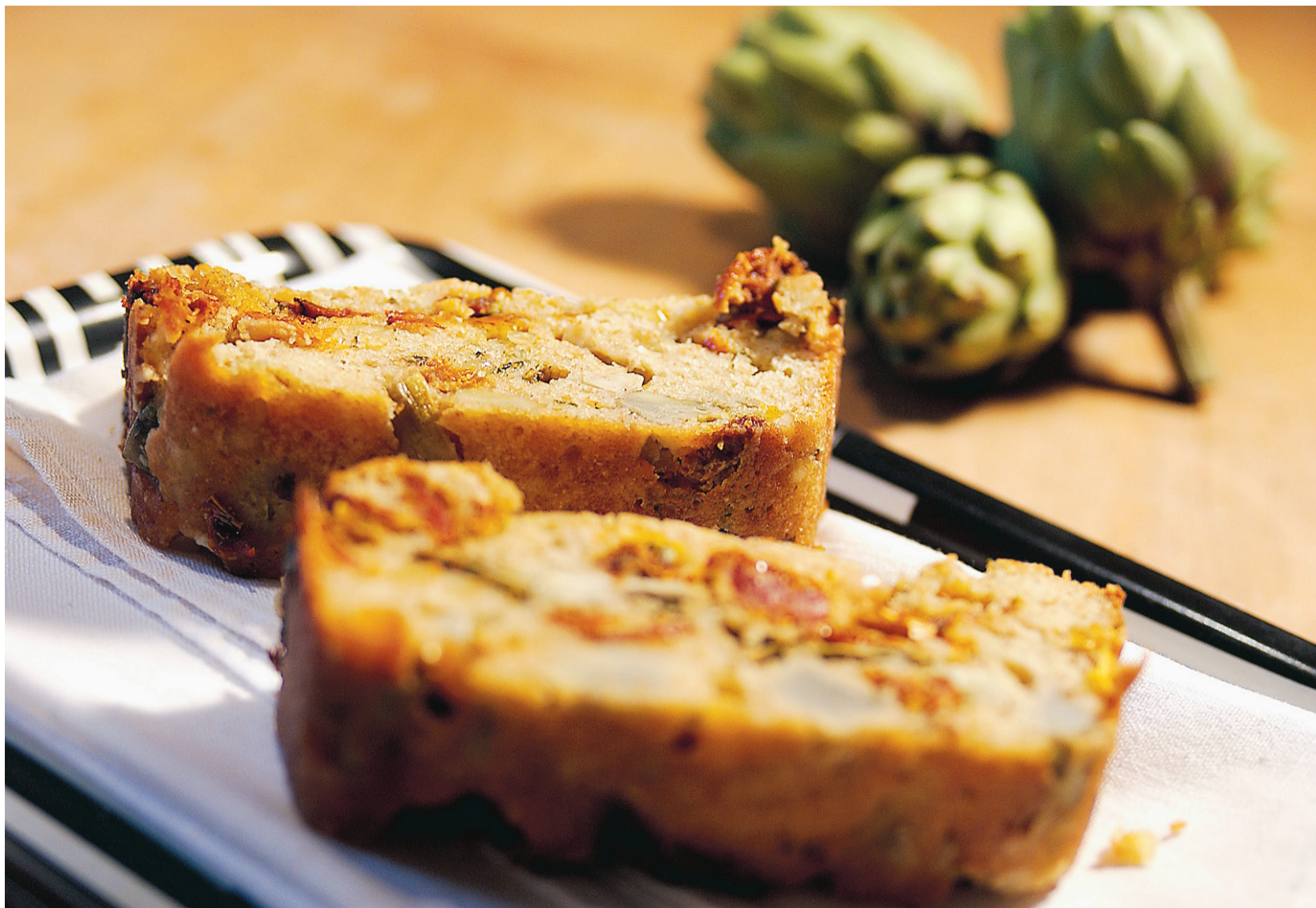
Cake aux artichauts et aux tomates séchées