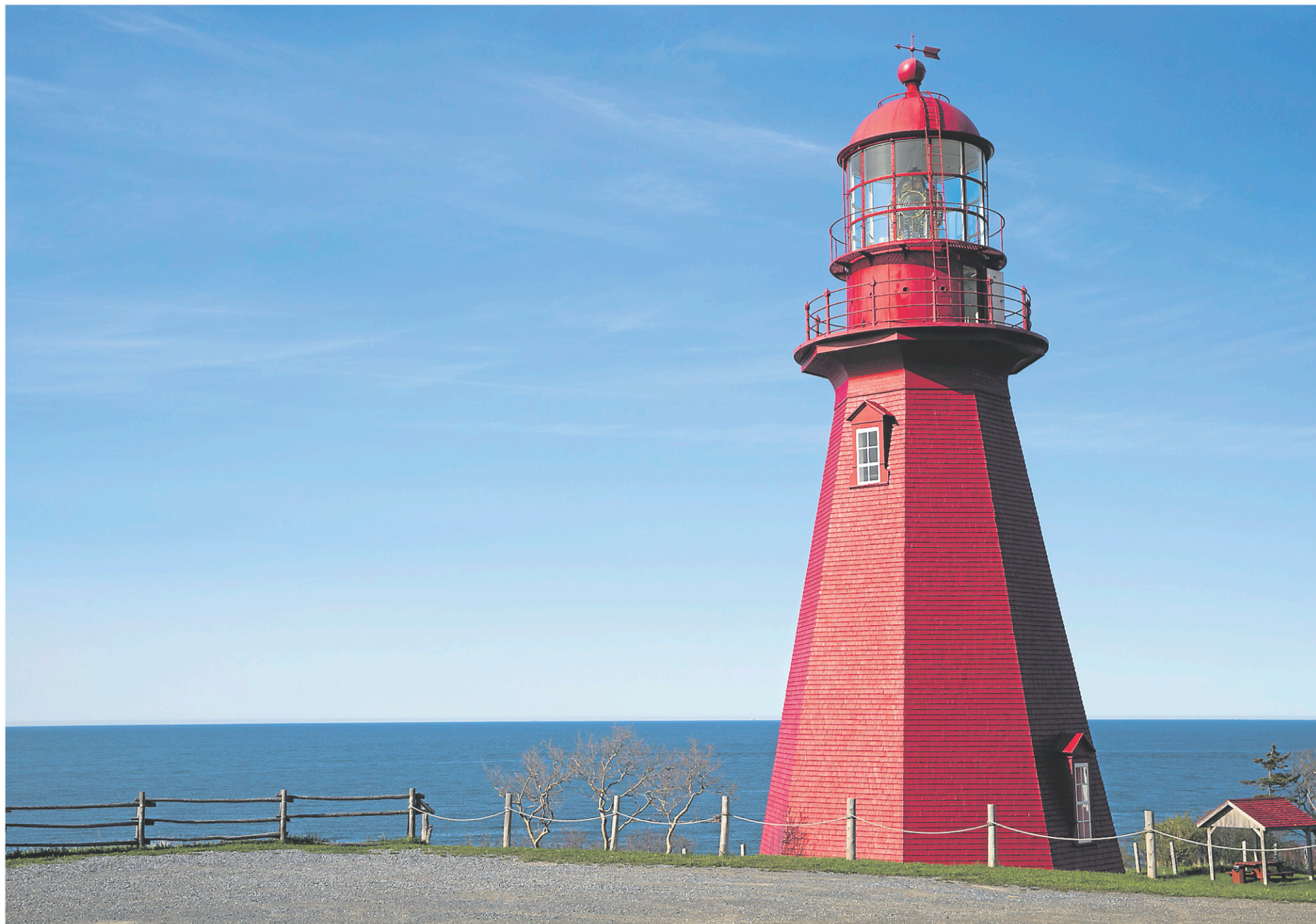
Tourisme Gaspésie explique que le contexte politique américain, la sécurité à l'international et la météo ont favorisé les décisions de dernière minute.