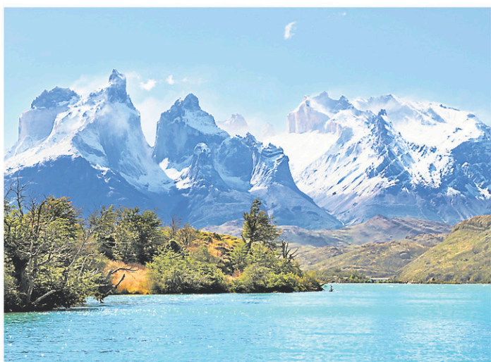
Le parc national Torres del Paine, Chili