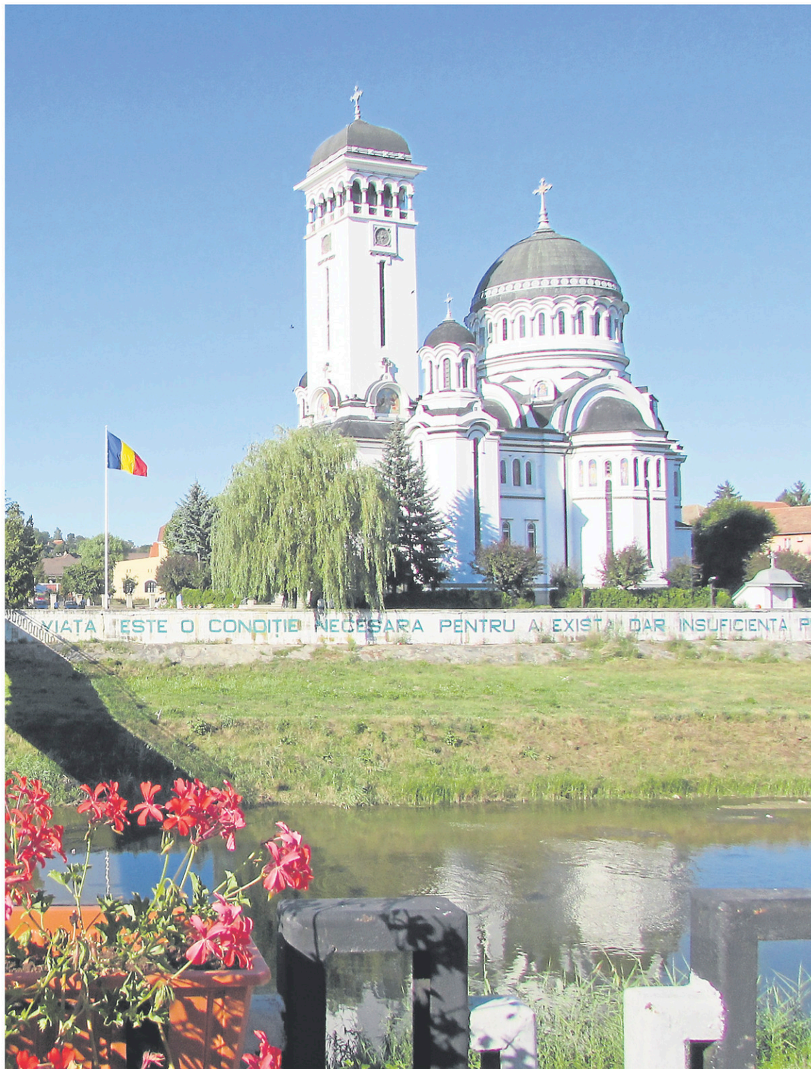
La plupart des petits villages roumains se visitent plus facilement avec une voiture de location, à l'exception de Sighisoara, qui est bien desservi par le transport en commun.

La Roumanie devient de plus en plus populaire. Outre sa gastronomie, elle présente un attrait pour sa riche histoire, notamment ses villes fortifiées et ses vieilles églises de bois. Louer une voiture constitue probablement le meilleur choix pour explorer les secteurs les plus intéressants. Ceux-ci sont souvent situés dans des villages ou quelque part en montagne. Mais attention, il faut prévoir la location longtemps à l'avance, sans quoi les plans pourraient être complètement chamboulés. C'est que les concessionnaires n'ont qu'un nombre limité de véhicules.