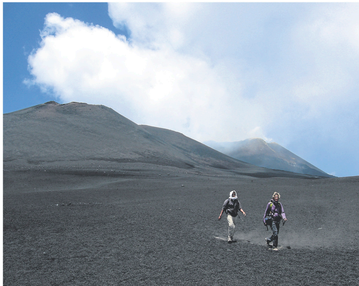
Les grands volcans d'Italie