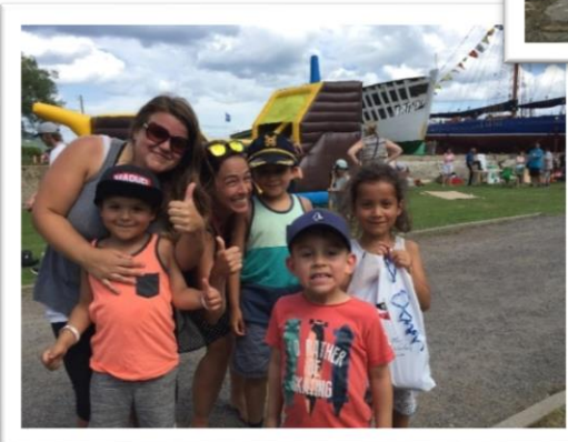
L'équipe gagnante du rallye culturel.