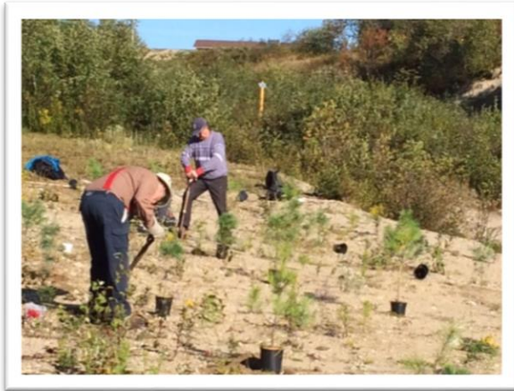
Plantation de pins dans le haut du sentier de la Forêt marine en septembre.