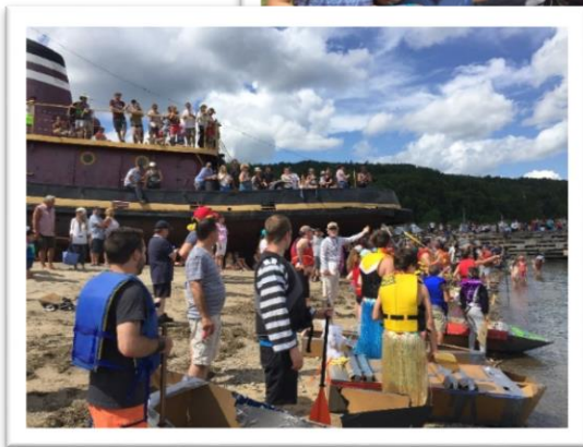
Au départ de la course des bateaux en carton.

La 29 e édition des Fêtes de la mer aura lieu le 19 juillet 2020.