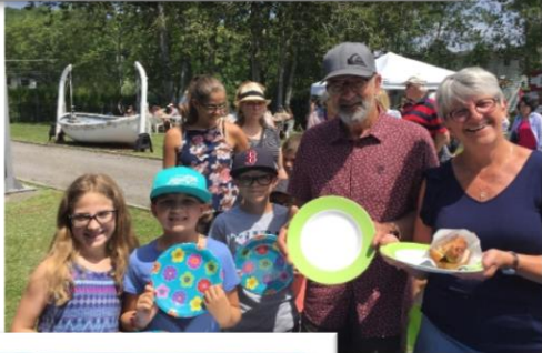
Une famille « bleue » ayant répondu à l'appel du Musée en apportant sa vaisselle réutilisable.