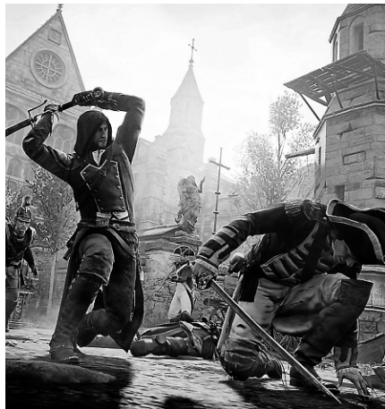
Ensemble, les épisodes Rogue et Unity de la franchise Assassin's Creed ont été commandés à près de 10 millions d'exemplaires par les distributeurs.

Ensemble, les épisodes Rogue et Unity de la franchise Assassin's Creed ont été commandés à près de 10 millions d'exemplaires par les distributeurs. L'entreprise a refusé de fournir un décompte