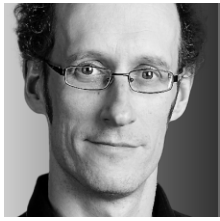
FRANCIS VAILLES CHRONIQUE

Il faut maintenant se poser sérieusement la question: le Québec peut-il se permettre de perdre Bombardier? Les Québécois peuvent-ils assister à la lente dégradation du fabricant de matériel de transport en haussant simplement les épaules?